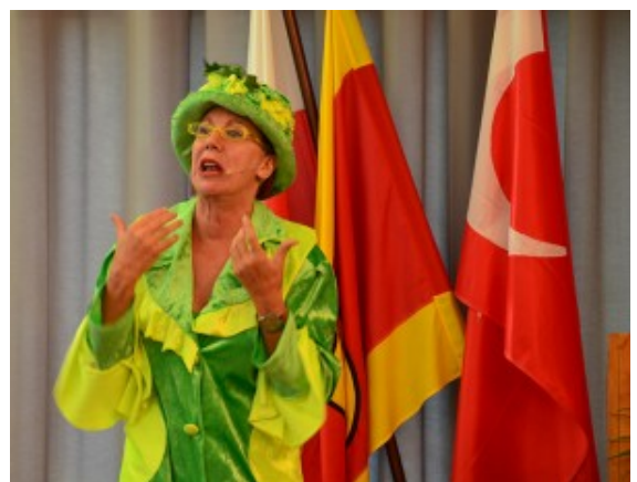
Die Kabarettistin in Aktion.