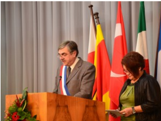
Gennevilliers Bürgermeister Jacques Bourgoin.

Es war auch deshalb ein besonderer Moment, weil es ihn so nie wieder geben wird. Taşucu wird im Rahmen einer kommunalen Gebietsreform im März Teil der Kreisstadt Silifke und wird keinen eigenen Bürgermeister mehr haben. Die beiden Stadtoberhäupter Gennevilliers werden im neuen Jahr nicht mehr für ihre Ämter kandidieren. Neue Gesichter prägen also schon bald die Städtepartnerschaften.