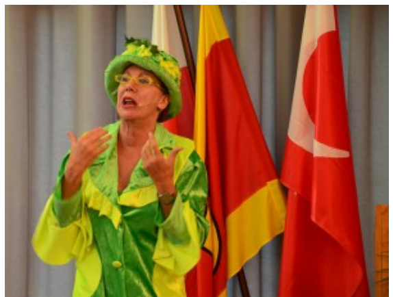
Die Kabarettistin in Aktion.