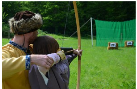
Zielgenauigkeit war bei den Römern auch mit Pfeil und Bogen gefragt.