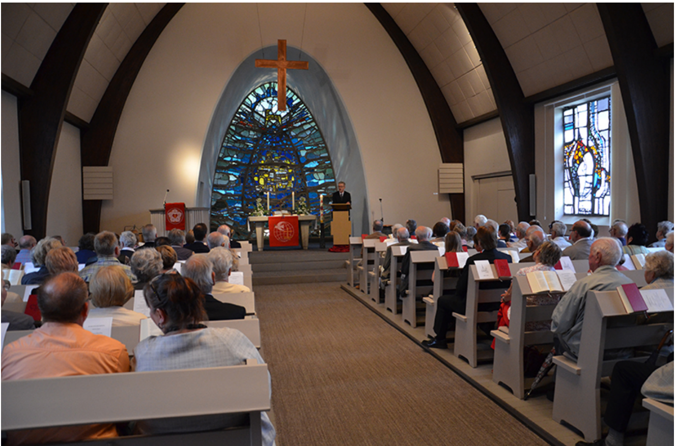
Volles Gotteshaus zum 60-Jährigen der Auferstehungskirche in