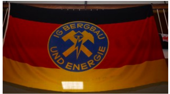
Die Gewerkschaftsfahne aus den 50er Jahren.

waren. Jetzt, in der Krise, stand ihre neue Heimat und Existenz auf dem Spiel.