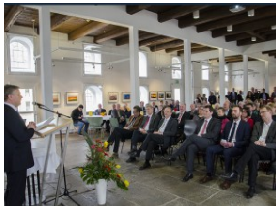
Gebanntes Zuhören zu einem Thema, „das uns bewegt“.

Bergkamen hat die Herausforderung der Flüchtlingskrise bislang vorbildlich bewältigt. Im „Krisenmodus“ des Vorjahres mit 1,1 Mio. registrierten Flüchtlingen „haben wir es auf kommunaler Ebene geschafft, das keiner auf der Straße sitzt, jeder ein Dach über dem Kopf hat und versorgt ist“, so Bürgermeister Roland Schäfer. Das sei vor allem auch mit enormem Einsatz, darunter 170 freiwilligen Helfern geschafft worden: „Darauf sind wir stolz, auf diese tolle Leistung unserer Gesellschaft!“ Daraus dürfe nun aber keine Parallelgesellschaft entstehen, sondern es bedürfe der Integration mit Unterstützung von Bund, Land und anderen Instanzen. Handfeste Statistiken und Erfahrung hatte Landrat Michael Makiolla zur Hand als Beleg dafür, dass ihm „nicht bange“ sei. Vor 25 Jahren habe der Kreis Unna mehr Flüchtlinge der Jugoslawienkriege aufgenommen als aktuell. „Auch das haben wir geschafft!“ Werde nach Köln vor allem das subjektive Sicherheitsgefühl diskutiert, sprechen die Zahlen auch hier eine andere Sprache: Es seien 2015 kaum Straftaten in Zusammenhang mit Flüchtlingen im Kreis registriert worden.