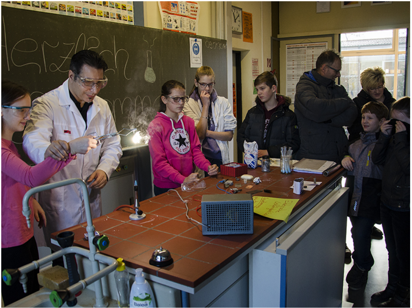
Beeindruckende Vorführungen gab es im Chemieraum.