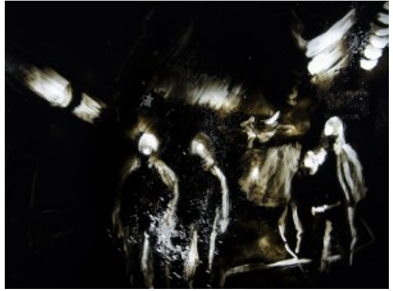
Silhouetten im Schacht – ein Ausschnitt aus einem Kunstwerk.