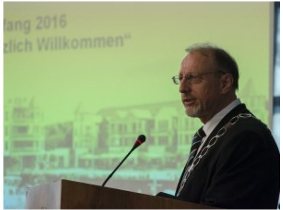
Bürgermeister Roland Schäfer bei seinem Rückblick und Ausblick.

Die Flüchtlinge standen auch im Mittelpunkt des traditionellen Rückblicks von Bürgermeister Roland Schäfer. Er dankte dem beeindruckenden ehrenamtlichen Engagement von Verbänden und Bürgern: „Sonst wäre all das auch nicht in humaner Weise zu leisten gewesen!“ Aktuell hat die Stadt 600 Flüchtlinge in Wohnungen untergebracht, 600 weitere Plätze bietet die Landeseinrichtung am Wellenbad. Die Zeltstadt wird im März aufgelöst. „Wie es dann weitergeht, was mit weiteren Zuweisungen von Flüchtlingen passiert, ist noch offen“, so Schäfer. Aber: „Wir werden das schaffen, wenn Bund, Land und EU ihre Aufgaben machen.“