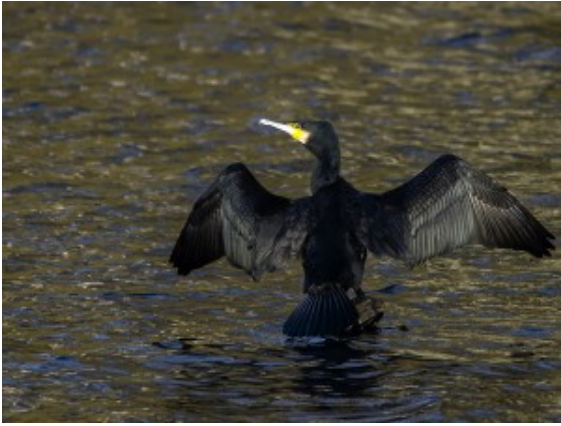
Ein Kormoran beim Sonnenbad.

Ebenso einmalig war der Auftritt eines Kormorans, der ein Sonnenbad in ein regelrechtes Fotoshooting verwandelte. Kreisende Mäusebussarde, schillernde Eisvögel auf der Jagd, vorjagende Rehe, verfrühte Zitronenfalter oder die Badeeinlage eines seltenen Zwergsägers und flanierende Schwäne sorgten zusätzlich dafür, dass diese Weihnachtswanderung den gut 40 Teilnehmern in Erinnerung bleiben wird.