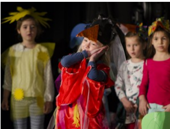
Buntes Treiben zum Auftakt bei der „Vogelhochzeit“.