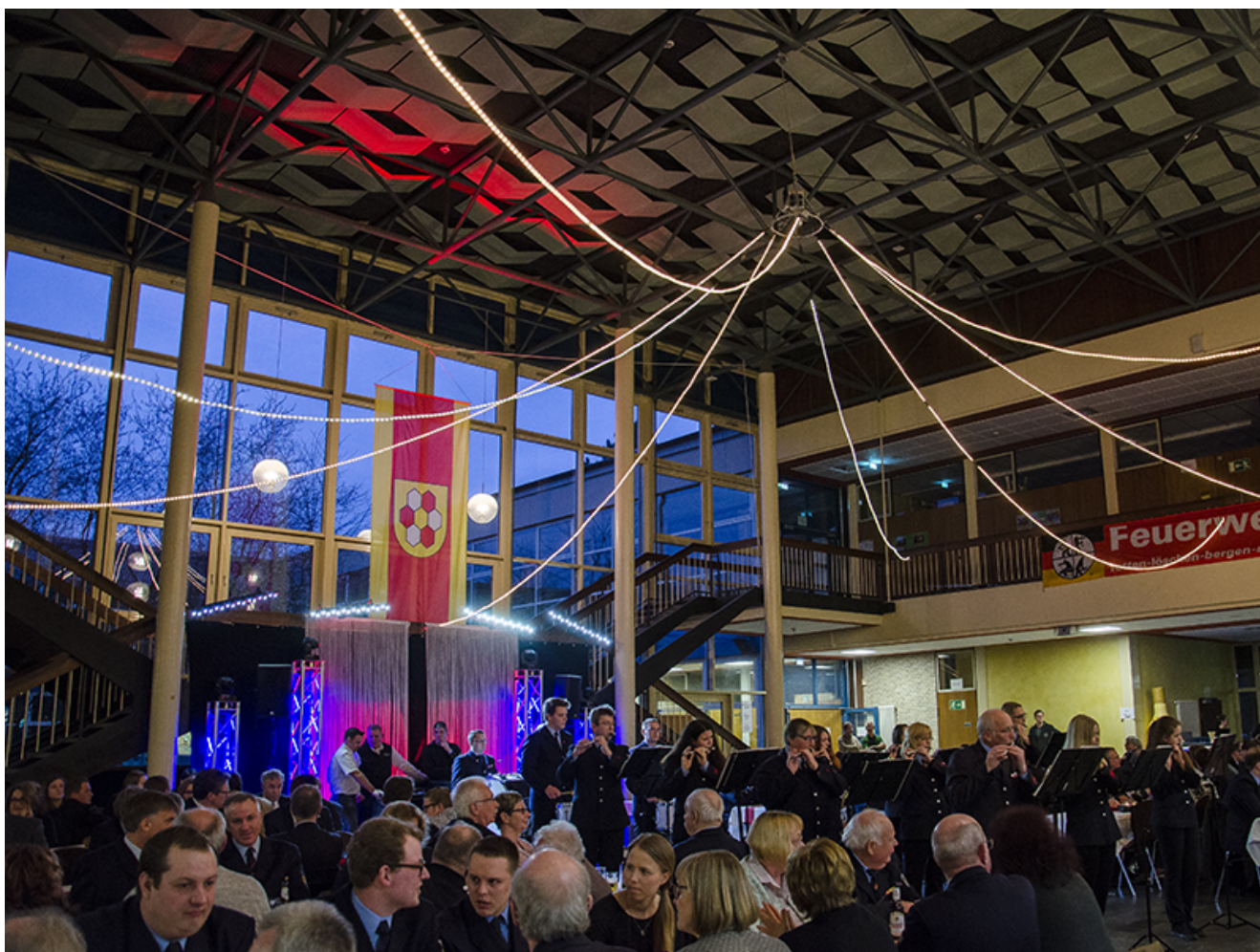
Volles Haus in der Aula der Realschule Oberaden beim Kameradschaftsabend der Freiwilligen Feuerwehr Bergkamen.

Wer sich bei der Feuerwehr engagiert, muss kreativ, ideenreich, mutig, idealistisch, randvoll mit Menschenliebe und uneigennützig sein. So die Zusammenfassung aller Gütezeichen, die beim Kameradschaftsabend der Bergkamener Wehrleute im Raum standen. Kurz gesagt: Feuerwehrleute sind besondere Menschen. Kein Wunder, dass in jedem Jahr mindestens einer von ihnen so hervorsticht, dass er eine besondere Auszeichnung bekommt.