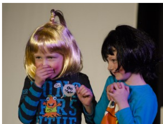
Verschmutzte Lausbuben als „Max und Moritz“ auf der Bühne.

13 Gruppen, rund 250 Kinder und Jugendliche, knapp 450 Besucher schon zur Halbzeit: Das 22. Theaterfestival des Bergkamener Stadtjugendrings war am Samstag einmal mehr ein Zuschauermagnet. Ganz nebenbei war die Großveranstaltung auch ein logistisches Großereignis für ehrenamtliches Engagement. Deutsches Rotes Kreuz, Friedenskirchengemeinde, DLRG, Pfadfinder, Schreiberjugend: Unzählige Helfer bieten Würstchen, buken Waffeln, stellten Getränke bereit, lotsten die Besucher zu den Zuschauerrängen und die Darsteller zu