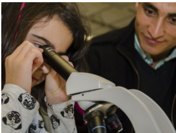
Blattstrukturen und Libellenlarven offenbarte das Mikroskop im Biologieraum.

Nicht nur für diese beiden Mädchen dürfte die Entscheidung für die Realschule in Oberaden spätestens mit dem Schritt in den Musikraum am Samstag gefallen sein. Viele Besucher drängelten