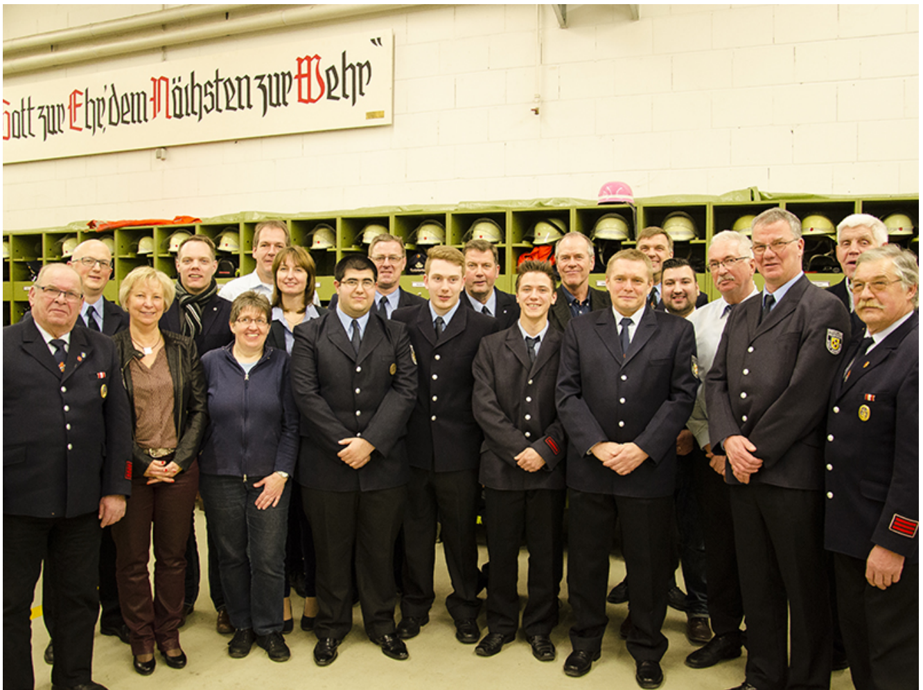
Geehrte, Befördere und Gäste: Die Weddinghofener Wehr.

Es waren zwar weniger Einsätze, zu denen die Lebensretter der Weddinghofener Wehr 2015 ausrücken mussten. Die hatten es aber dennoch in sich. Vor allem Brände hielten die 40 Wehrleute in Atem. Gleich mehrfach wurden dabei Leben gerettet.