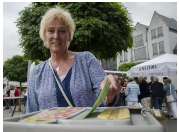
Engagement auch an der Quizbox für das Weinquiz.

„So etwas wie das Fest hier in Bergkamen macht richtig Spaß“, sagt Kuhfuß, der begeistert beobachtet, wie die Schlangen an seinem Weinstand immer länger werden. Auch Weine aus Australien probieren die Bergkamener mit Entdeckergeist. Dazu Käse und Pasta aus Italien, Flammkuchen, Tapas zum spanischen Wein. Mitten drin im Getümmel die S.O.S. Mobilband, die sich mit Kontrabass, Saxophon, Gitarre und Percussion mitten in die Menschenmenge stürzt.