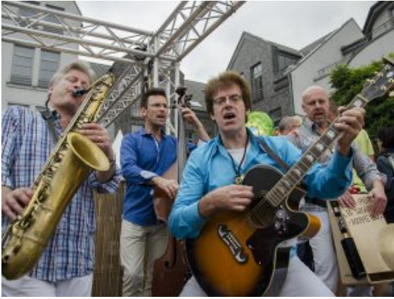
Engagiert im Einsatz: Die S.O.S Mobilband.

„So etwas wie das Fest hier in Bergkamen macht richtig Spaß“, sagt Kuhfuß, der begeistert beobachtet, wie die Schlangen an seinem Weinstand immer länger werden. Auch Weine aus Australien probieren die Bergkamener mit Entdeckergeist. Dazu Käse und Pasta aus Italien, Flammkuchen, Tapas zum spanischen Wein. Mitten drin im Getümmel die S.O.S. Mobilband, die sich mit Kontrabass, Saxophon, Gitarre und Percussion mitten in die Menschenmenge stürzt.