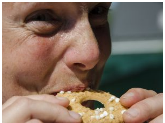
Lecker: Flächenberechnung über Kekseknabbern.

nicht zu bewältigen ist. Denn hier mussten Erbsen mit Essstäbchen von einem Napf in den anderen gefüllt, Wasser mit einem mehr als flexiblen Gefäß über, durch und unter Klettergerüste transportiert oder Teebeutel einzig mit den Zähnen so weit wie möglich geschleudert werden. Das Ganze auf einem mehr als 4 Kilometer langen Parcours durch das Stadtgebiet bei satten 36 Grad. Da waren die feuchtfröhlichen Unfälle beim Hürdenlauf oder bei der hochkomplizierten Umsetzung von Algebraformeln mit widerspenstigen Wassergefäßen eine willkommene Erfrischung.