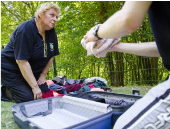
Koffer packen für den Schulausflug

Jedenfalls bekamen am Ende auch so kuriose Gruppen wie die Abiturlosen ihr Reifezeugnis. Sogar ganze Familien gingen wieder in die etwas andere Schule, ein Eskalationskommando trat geschlossen an und auch die rasenden Blutkörperchen schlugen sich tapfer in der Hitze. Die Weddinghofener Löschgruppe war jedenfalls begeistert, hatten sich doch fast doppelt so viele Gruppen zur Prüfung angemeldet wie noch bei der Premiere vor zwei Jahren. Und auch in diesem Jahr waren die Prüfungsfächer ganz allein feuerwehreigene Kreationen. 30 Kameraden betreuten den ganzen Tag lang die Prüfungsstationen, sorgten für Leckereien und Erfrischungen. Auch die Jugendfeuerwehr, Partner und hilfreiche Menschen aus Weddinghofen packten kräftig mit an.