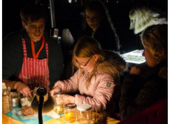
Begeisterte Lichtkunst mit dem Präparat im Dunkel des Stadtwaldes.

hatten. Fast in Zeitlupe formierten sich dort Männer in eleganten Kraftanstrengungen zu Pyramiden, erklimmen auf den Händen Stühle oder entlockten den Gliedmaßen erstaunliche Geschmeidigkeit an halbrunden Stahlgerüsten. „LaMetta“ hielt, was der Name versprach, und erzählte mit den Körpern bezaubernde Pantomime-Geschichten.