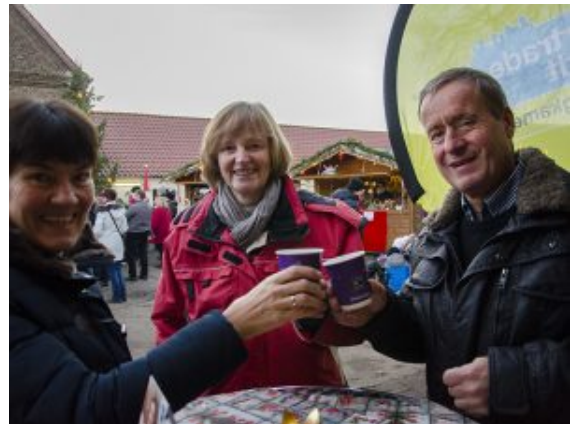
Fair gehandelter Kaffee zum Anstoßen und Aufwärmen.