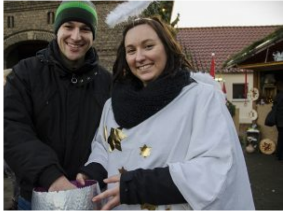
Loseziehen für die große Tombola.

Der Weihnachtsmarkt in Heil ist nicht nur deshalb ein ganz besonderer. Zwischen den gerade einmal fünf Buden und zwei Zelten drängelte sich auch bei der dritten Auflage am Samstag eine beeindruckende Zahl von Besuchern. Das, was hier ganz und gar von den Heilern in Handarbeit auf die Beine gestellt wird, zieht magisch an. Auch deshalb, weil in jedem einzelnen Detail viel Arbeit und Engagement stecken. Zum Teil das ganze zurückliegende Jahr über.