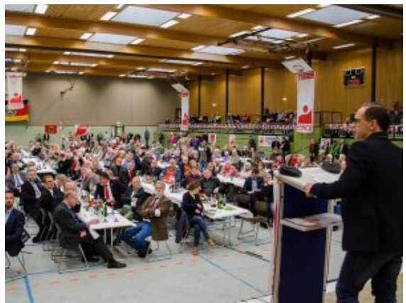
Blick in die gut gefüllten Ränge.

Heiko Maas fühlte sich in Oberaden jedenfalls pudelwohl. Hier sei anders als an einem anderen 1. Mai in Zwickau mit rechtsgerichteten Begleiterscheinungen „die Welt noch in Ordnung“. Denn „hier gehört der 1. Mai nicht den Populisten, sondern den Arbeitnehmern und Gewerkschaften“. Wer an seiner Qualifikation zum Festredner als Saarländer und Justizfachmann zweifelte, dem nahm er gleich den Wind aus den Segeln. Auch im Saarland sei der Bergbau lange Thema gewesen – ebenso die Konkurrenz zum Ruhrgebiet. Was viele inzwischen vergessen hätten: Das Saarland hatte bis 1954 eine eigene Olympia- und vor allem Fußballnationalmannschaft, die nicht nur mit einer großzügigen Niederlage gegen die deutschen Fußballer deren Weltmeistertitel und damit auch das Wirtschaftwunder ermöglicht hätte. Auch am neuen Länderfinanzausgleich habe er selbst mitgewirkt. „Saarländer sind also durchaus zu