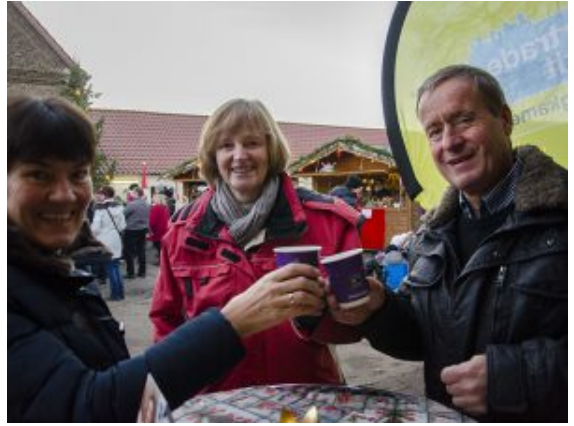
Fair gehandelter Kaffee zum Anstoßen und Aufwärmen.