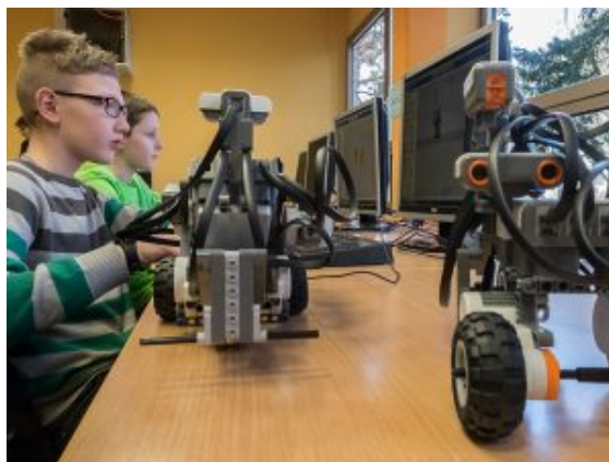
Roboter standen für Erkundungstouren bereit.