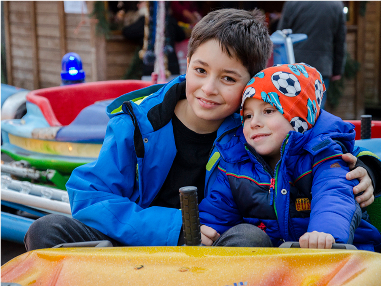
Geschwisterliche Harmonie im Karussell.