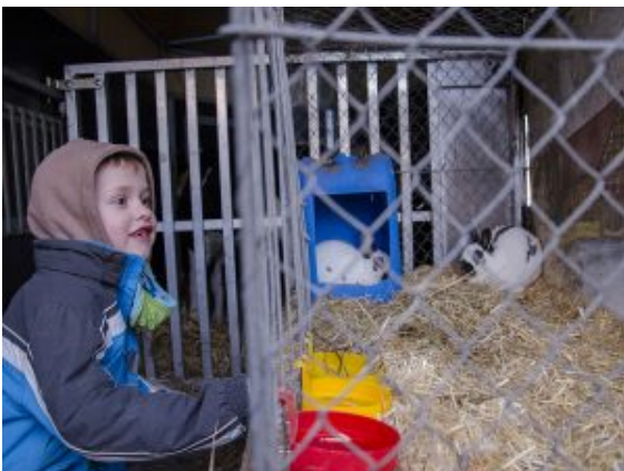
Die Tiere faszinierten die Kinder.