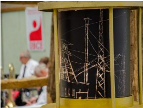
Bergbauambiente in der Römerberghalle.