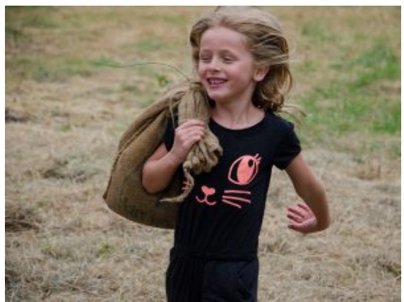
Vollgas beim „Airbag-Run“ der Mini-Highlandgames.