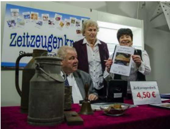
Auch die Zeitzeugen waren mit einem eigenen Stand vertreten.

Wer denkt, dass sich nach 20 Jahren eine Art Gewöhnungsfaktor einschleicht, der täuscht sich. Auch am Wochenende drängten sich die Menschen auf dem Museumsplatz und in den Museumsräumen, um Reibekuchen zu probieren, den Kindern im