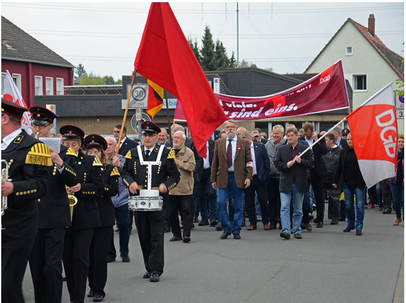
Marsch zur Römerberghalle.

Ein Bollerwagen mit gewaltiger Beschallungsanlage und ebenso imposanten Spirituosenvorräten auf der einen Seite. Auf der anderen Spielmannszüge, Gewerkschaftsbanner und das Bergmannslied. Beide beäugten sich kurz einigermaßen befremdet und zogen dann ihrer deutlich verschiedenen Wege. Zumindest in Oberaden haben Letztere am 1. Mai noch knapp die Oberhand. Das dürfte vor allem an den traditionell hochkarätigen Rednern liegen. Bundesjustizminister Heiko Maas mobilisierte immerhin knapp 300 Demonstranten und 500 Zuhörer zur Maikundgebung in der Römerberghalle.