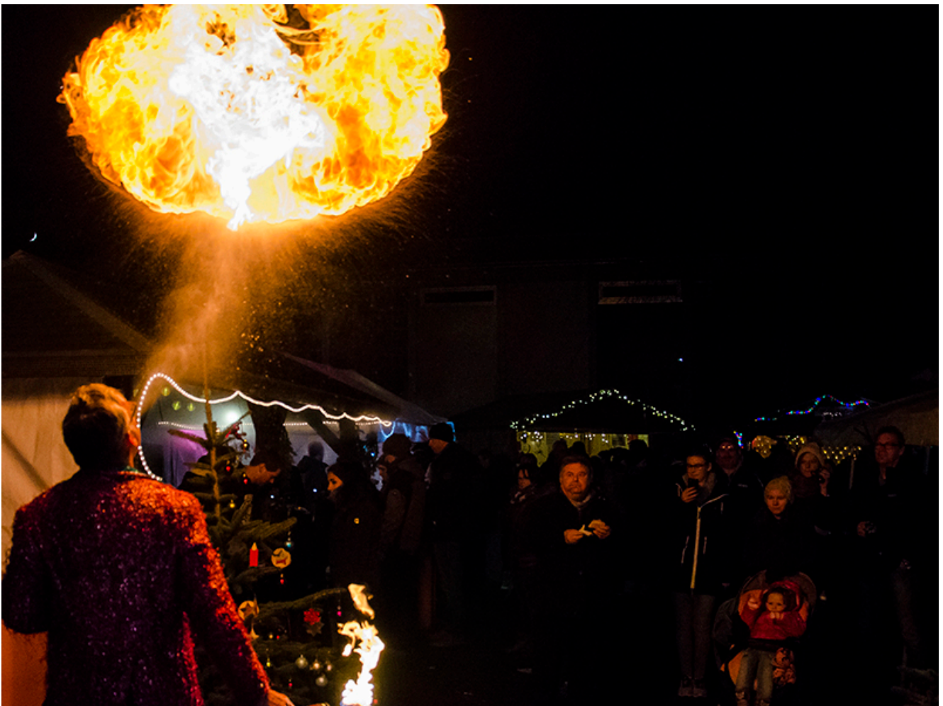
Feurige Darbietungen auf dem Rünther Weihnachtsmarkt.

Das Feuer stob in regelrechten Wolken aus seinem Mund. Der Mann, der eben noch ganz harmlos Luftballons in Papageien und Pudel verwandelt hatte, entpuppte sich als wahrer Action-Star des Abends. Dem Nikolaus lief er auf dem Rünther Weihnachtsmarkt jedenfalls heimlich den Rang ab.