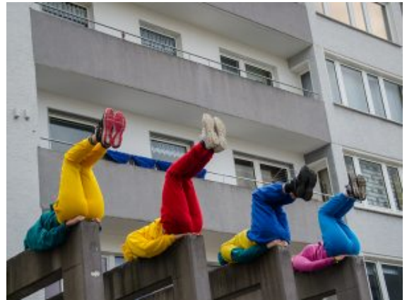
Gereckte bunte Beine vor einem Wohnkomplex.

Busbahnhof scheinbar mühelos in luftiger Höhe schweben.