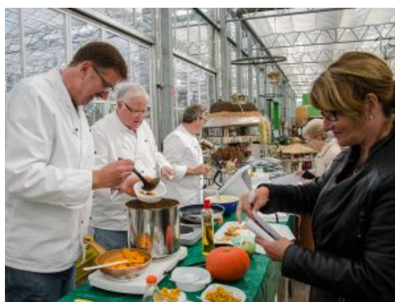
Anstehen an der professionell