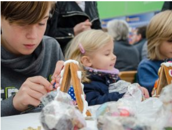
Hochkonzentriert waren auch die größeren Weihnachtsbastler bei der Sache.

Wer sich derart kreativ auf die Weihnachtszeit vorbereitet, der kann ganz schön hungrig werden. Deshalb leisteten auch die Waffeleisen auf dem Außengelände Akkordarbeit. Kaffee und