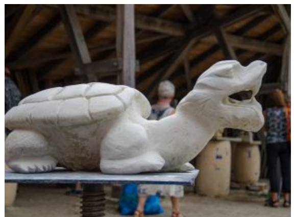
Ganz schön bissig: Eine Schildkröte aus Stein