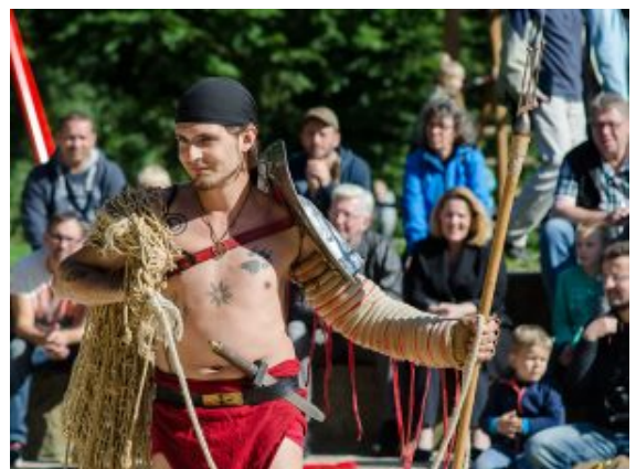
Der Retiarius stellt sich vor.