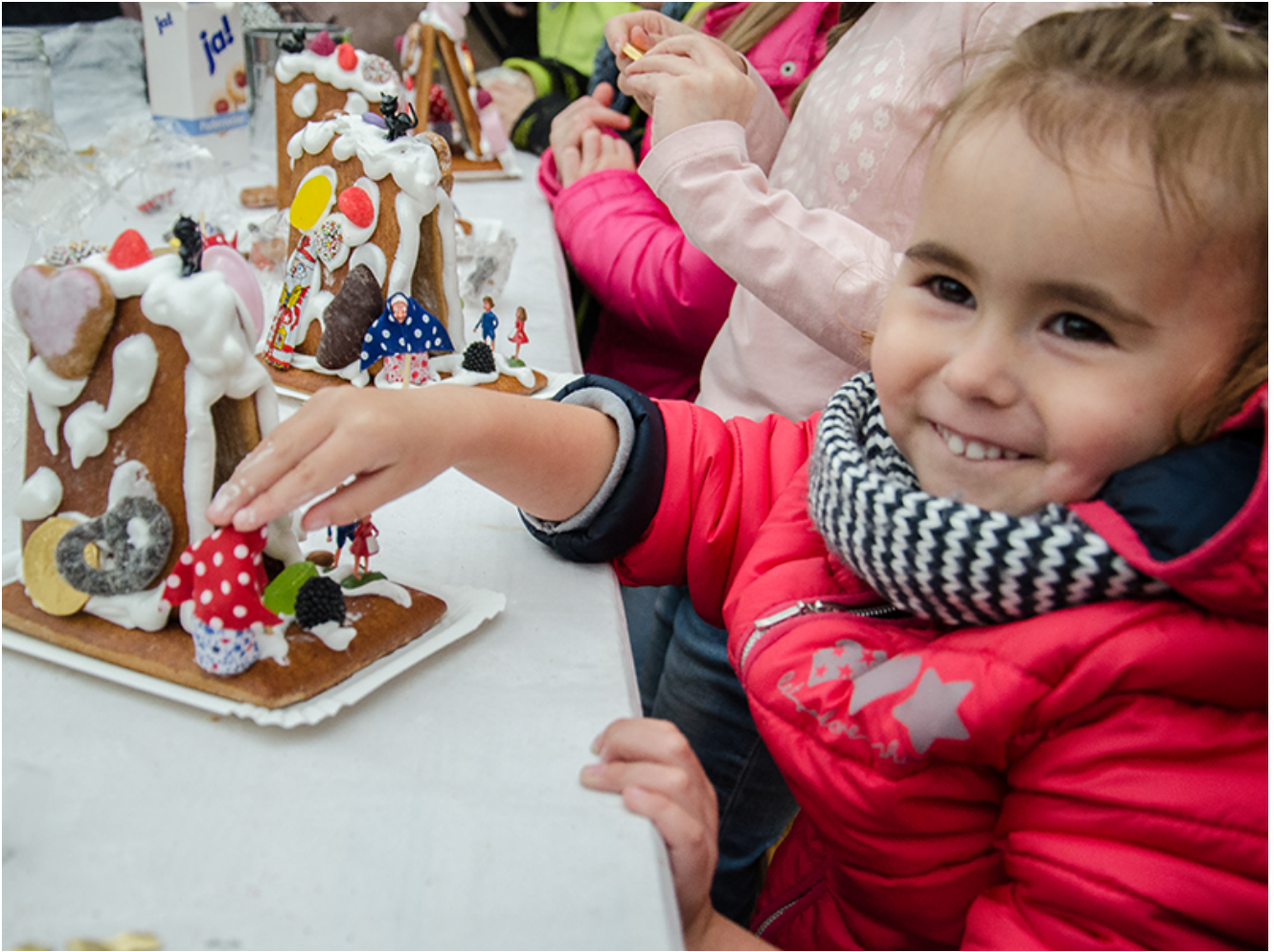
Riesige Begeisterung über das fertige Knusperhäuschen.