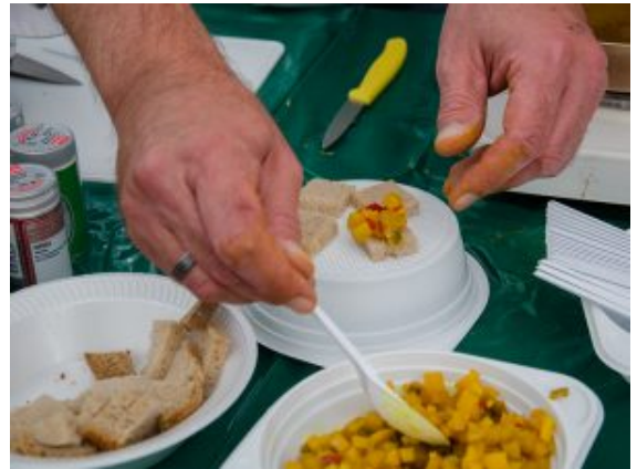
Ein raffiniertes Chutney wird auf dem Brot verteilt.

Flinke Hände zerlegen einen Kürbis in Scheiben und Würfel. Öle und Gewürze werden hier hinzugefügt und ergänzen dort das Arrangement in Töpfen und auf Tellern. Es wird umgerührt, aufgeschichtet, geschüttelt, eingeschenkt. Immer dichter ist die Menschenmenge, immer größer das Sammelsurium an vergessenen Einkaufswagen, immer knapper wird der Stapel mit den Kopien der Rezepte. Wo vor ein paar Jahren die meisten nur die Nase rümpften angesichts stundenlanger Schnippelarbeits oder fader Geschmäcker, hat sich eine regelrechte Kürbis-Euphorie verbreitet.