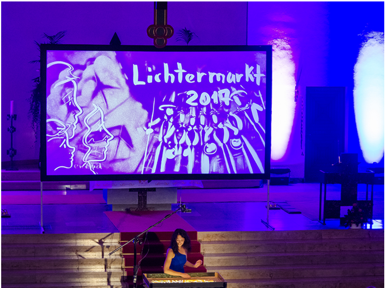
Bezaubernd: Sandmalerei in der Elisabethkirche.

Kerzen glimmen wahlweise in LED-Form auf ihren Köpfen oder als echte Flammen an ihren Füßen. Das Ambiente im Bergkamener Schloss war beim Lichtermarkt 2017 eben ganz stilecht.