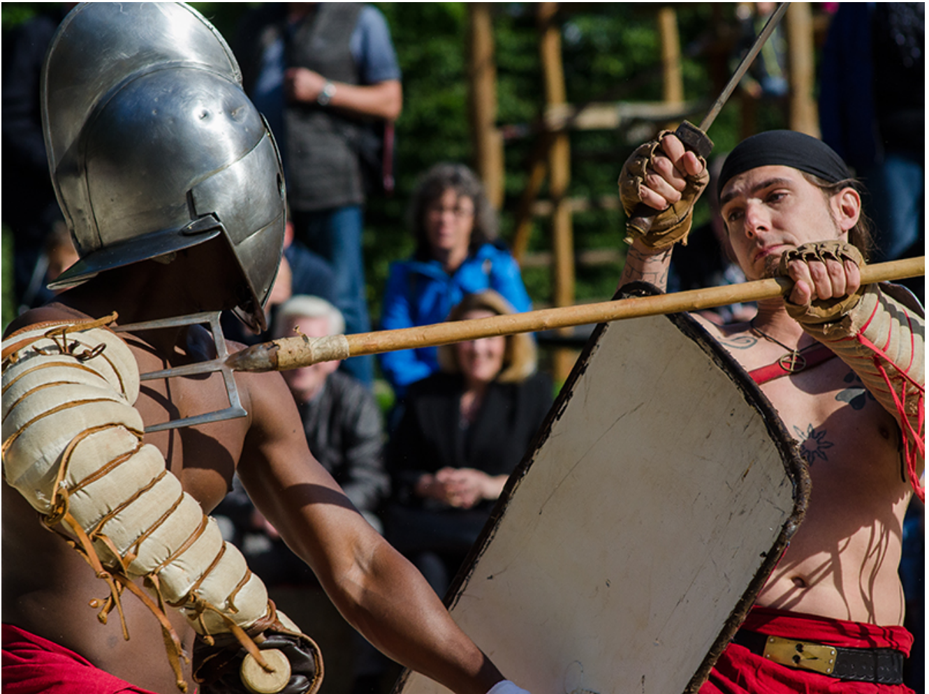
Brot und Spiele: Die Gladiatoren in Aktion.

schon eine Schramme am Arm!“ Auch darauf weiß die jugendliche Gladiatoren-Expertin eine Antwort: „Dafür hat er ja die Manicas! Das passiert schon mal.“