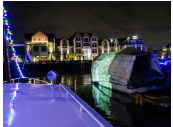
Eingepackte Boote als Installationsfläche in der Hafeneinfahrt.

Auf der Rückfahrt tauchten weitere Worte an der Brücke auf, bevor es wieder in den illuminierten Hafen ging, wo auf dem Kai das PulsLicht von Mischa Kuball Signale sendete. Auf einem weiteren Boot glitten Enten durch das Wasser und wurden von weiteren Fotos abgelöst, die Silke Kieslich in eine Lichtprojektion verwandelt hatte. Die Künstlerin Nikola Dicke und Stadtführer Klaus Holzer begleiteten die Touren und erläuterten die jeweiligen Installationen.