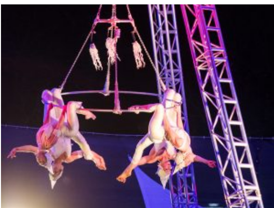
Ein Kronleuchter aus akrobatischen Körpern.