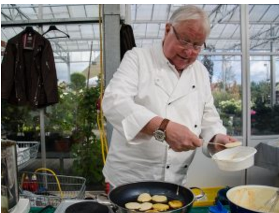
Ab in die Pfanne: Der Teig für die Pancakes ist bereit.

Flinke Hände zerlegen einen Kürbis in Scheiben und Würfel. Öle und Gewürze werden hier hinzugefügt und ergänzen dort das Arrangement in Töpfen und auf Tellern. Es wird umgerührt, aufgeschichtet, geschüttelt, eingeschenkt. Immer dichter ist die Menschenmenge, immer größer das Sammelsurium an vergessenen Einkaufswagen, immer knapper wird der Stapel mit den Kopien der Rezepte. Wo vor ein paar Jahren die meisten nur die Nase rümpften angesichts stundenlanger Schnippelarbeits oder fader Geschmäcker, hat sich eine regelrechte Kürbis-Euphorie verbreitet.