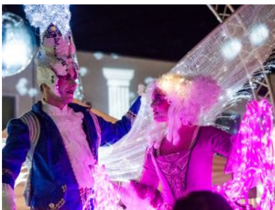
Funkelnde Rokokogestalten schwebten über den Stadtmarkt.