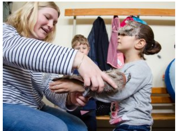
Vorbereitungen hinter der Bühne für den ersten großen Auftritt als Wachtel.

Türkei und fächert sich lässig mit chinesischen Fächern Luft zu. Es war nicht leicht in diesem Jahr für die Kinder der Kita-Tausenfüßler. Seit Januar haben sie eifrig ihr Stück geübt, für das sogar eigene T-Shirts angefertigt wurden. Jetzt, kurz vor dem Auftritt, sind sechs von 16 Kindern krank. Schon im Vorjahr musste der Auftritt beim Theaterfestival ausfallen, weil es so viele Krankheitsfälle gab. Jetzt sind die Kinder aber tapfer und wollen unbedingt zeigen, was sie so lange geübt haben. Sie alle stehen zum ersten Mal auf der Bühne. Der tosende Applaus ist Belohnung genug. Und dann gibt es ja noch so viele spannende Aufführungen der anderen Kinder und Jugendlichen.