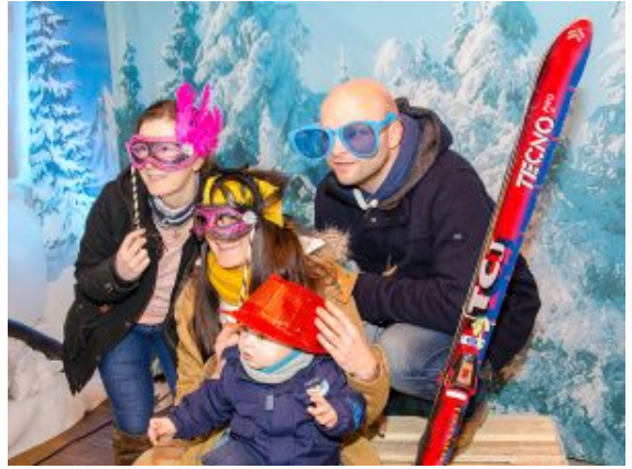
Fotospaß im winterlich-surrilen Outfit in der Kinder-Winterwelt.

Kinderleicht war für die meisten jungen Besucher der Kinder-Winterwelt der Umgang mit den Stiften beim Malen oder das Posieren mit der ganzen Familie in skurrilem Winter-Outfit vor der Fotobox. Pinguine wollten hier mit Kunstschnee berieselt und Eisbären im eisigen Ambiente bestaunt werden. Draußen wurde es immer kälter, da halfen nur noch ein deftiger Punsch, eine heiße Wurst, ein Flammkuchen oder ein Tänzchen zur Musik, die bei der Hafenfeuer-Party aufgelegt wurde.