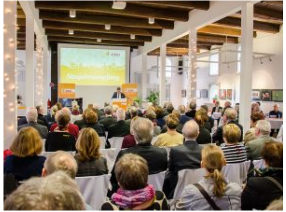
Gut besetzte Stuhlreihen in der Ökologiestation.

Besondere Kritik erntete der ehemalige NRW-Innenminister Ralf Jäger, der bei allen Problemen von massenhaften Ausbrüchen aus JVA's, „No-Go-Areas“ im Land bis zu Übergriffen auf Frauen nie selbst verantwortlich gewesen sei. Mit der „Bankrotterklärung für die Bildungspolitik“ angesichts der Folgen der Schließung von Förderschulen werde die CDU jetzt Schluss machen. Lehrermangel trotz neu geschaffener aber unbesetzter Stellen, unterschiedliche Lehrervergütung, mehr ärmere Kinder als zuvor: Die CDU betreibe jetzt gelebte Sozialpolitik. Für die Wirtschaft im Ruhrgebiet fordert er „mehr Flächen“, entsprechende Gesetze und Akzeptanz in der Bürgerbeteiligung. Wohnen und arbeiten gleichzeitig sei im Ruhrgebiet quasi nicht mehr möglich. Was das Ruhrgebiet einst entstehen ließ, ist verschwunden und muss erst wieder „hervorgeholt“ werden. Flächen gehen durch den Bestandsschutz für Unternehmen im Baurecht verloren, dieser Schutz müsse auf die Flächen ausgeweitet werden. In anderen Regionen Westfalens gibt es längst mehr sozialversicherungspflichtige Beschäftigte als im Ruhrgebiet. Aber: „Die Menschen hier haben es verdient, wieder vor Ort malochen zu können.“