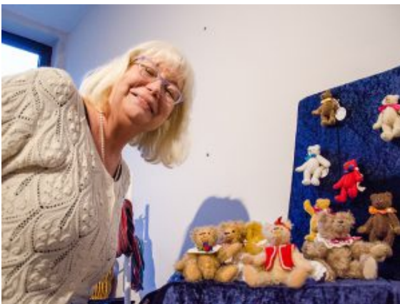
Mini-Teddybären handgemacht – auch das hat Oberadener Weihnachtsmarkttradition.

Draußen brutzelt das Stockbrot im Feuer der DLRG, die Besucher schauen sich die Bilderausstellung von SuS an, hören den Liedern auf der Bühne zu, probieren ein Fischbrötchen und Gyrossuppe und nehmen ein Glas eingemachte Marmelade von der Kindertagesstätte mit. Im Museum wird das Gedränge vor den Ständen dichter. Da bilden sich ganze Trauben vor ganzen Wäldern aus Miniatur-Weihnachtsbäumen, die in Reih und Glied neben einer Heerschar von Nikoläusen und Mikro-Engeln Spalier stehen.