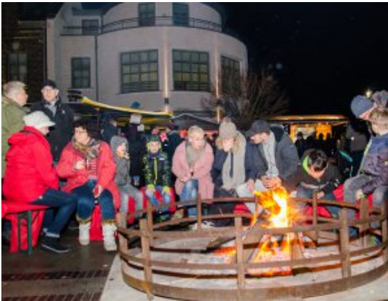
Aufwärmen am Lagerfeuer.

seine Mitstreiter, die bereits seit 18 Jahren aus der Feuerfaszination einen Profession gemacht haben.