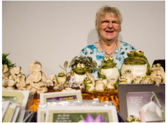
Töpferkunst en masse aus dem eigenen Töpferofen.

Geschenkesuchende am Wochenende aber immer noch. Mancher konnte sich nicht entscheiden zwischen selbstgenähten Taschen, hunderten von Stricktüchern, Holzfiguren in allen Varianten, Schmuck, gebastelten Weihnachtskarten und winzigen Weihnachtskugeln, die ganze Schneelandschaften in sich trugen.