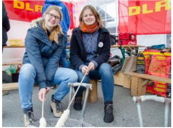
Stockbrot gab es bei der DLRG.

Draußen brutzelt das Stockbrot im Feuer der DLRG, die Besucher schauen sich die Bilderausstellung von SuS an, hören den Liedern auf der Bühne zu, probieren ein Fischbrötchen und Gyrossuppe und nehmen ein Glas eingemachte Marmelade von der Kindertagesstätte mit. Im Museum wird das Gedränge vor den Ständen dichter. Da bilden sich ganze Trauben vor ganzen Wäldern aus Miniatur-Weihnachtsbäumen, die in Reih und Glied neben einer Heerschar von Nikoläusen und Mikro-Engeln Spalier stehen.