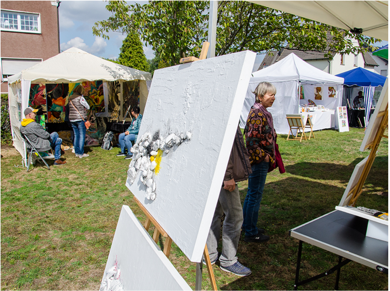
Wiese und Pavillons: Der 2. Kunstmarkt in Rünthe lockte unter den freien Himmen.