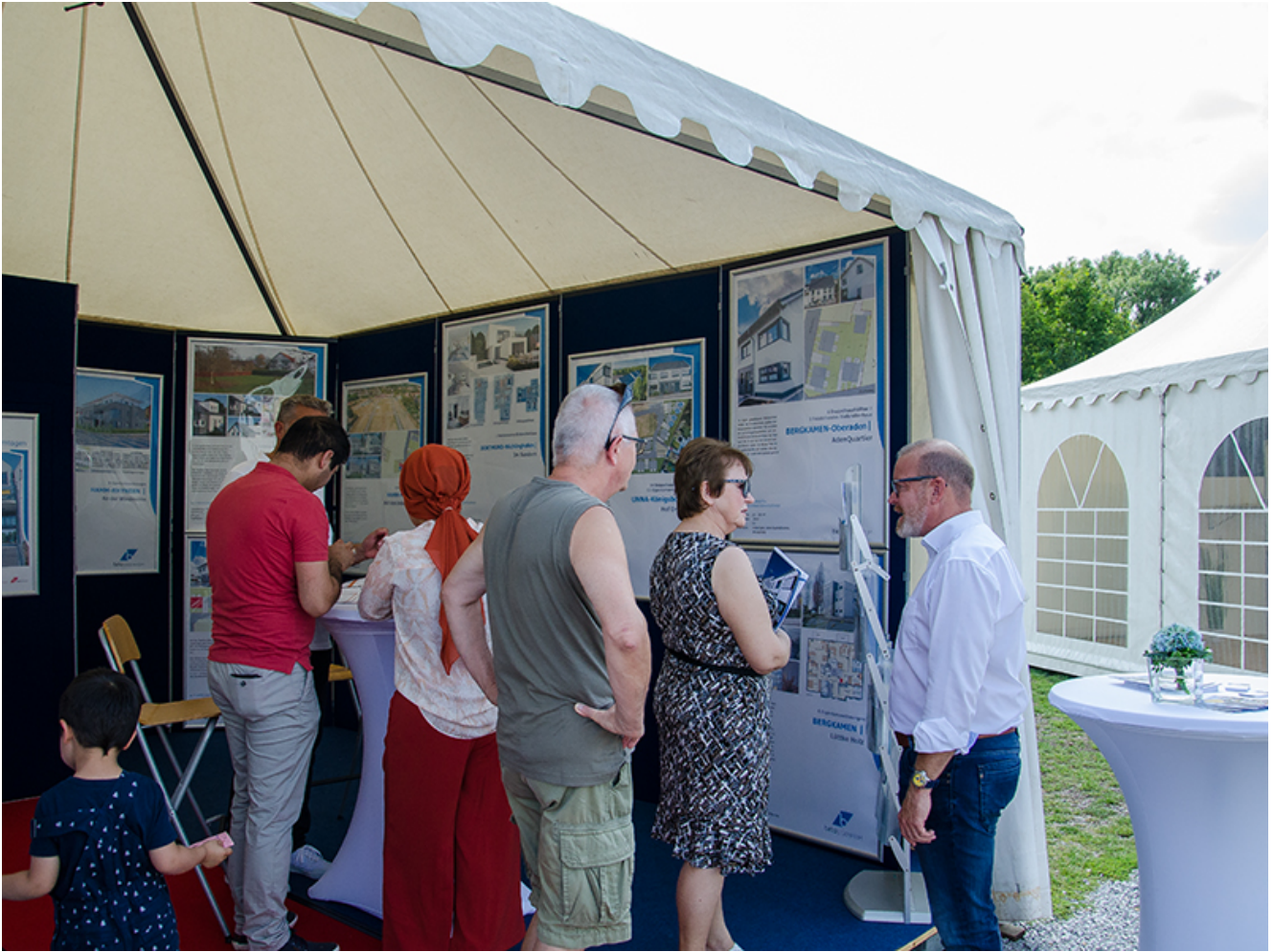
Beratung im Beta-Zelt.