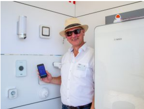
Alles im Griff mit dem Handy – von der Raumlüftung bis zur Heizung.

Nicht nur nach einer kraftvollen Raumlüftung sehnten sich viele Besucher der 14. Bergkamener Eigenheimtage vor allem am Samstag, als sich auch in den Zelten in der Marina Rünthe die Luft auf subtropische Temperaturen aufgeheizt hatte. Vor allem