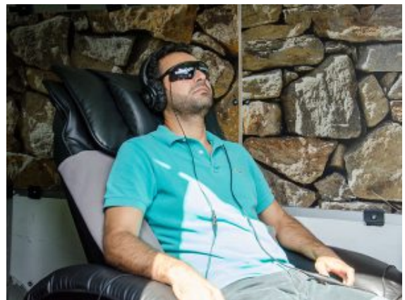
Entspannung im Massagesessel.