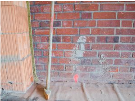
Alte und neue Mauern direkt nebeneinander.

Dafür wird hinter und vor den Kulissen hart gearbeitet. Die Ausstellungsstücke werden dokumentiert, demnächst allesamt verpackt und eingelagert, es wird mächtig geräumt und gebaut. „Wir sind eben eine richtige Baustelle“, schilderte es Museumsmitarbeiterin Ludwika Gulka-Hoell mit viel Herzblut und Vorfreude. „Damit werden wir viel mehr Möglichkeiten haben, die Ausstellungen neu zu gestalten und den Besuchern besser gerecht zu werden.“