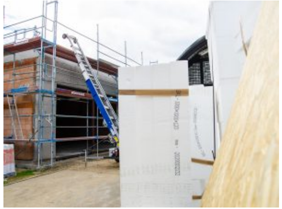
Gerüste am Neubau.

Dafür wird hinter und vor den Kulissen hart gearbeitet. Die Ausstellungsstücke werden dokumentiert, demnächst allesamt verpackt und eingelagert, es wird mächtig geräumt und gebaut. „Wir sind eben eine richtige Baustelle“, schilderte es Museumsmitarbeiterin Ludwika Gulka-Hoell mit viel Herzblut und Vorfreude. „Damit werden wir viel mehr Möglichkeiten haben, die Ausstellungen neu zu gestalten und den Besuchern besser gerecht zu werden.“