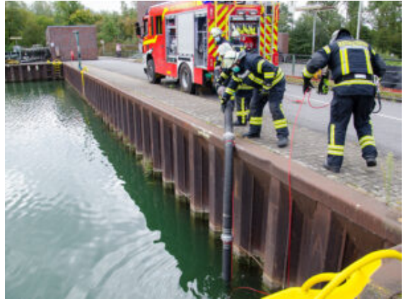
Wasserentnahme im Kanal.

Wie wird ein Schlauch richtig ausgerollt. Welche Gerätschaften sind in welchem Fahrzeug verborgen. Wie muss mit welchem Löschmittel umgegangen werden und wie läuft ein Brand überhaupt ab? Menschenrettung, erste Hilfe: Es ist viel, was die Teilnehmer lernen müssen. Das wir theoretisch und auch mündlich mit Prüfungen abgefragt. Und auch in der Praxis mussten sie alle am Sonntag zeigen, dass sie Saugleitungen kuppeln, einen Löschangriff richtig aufbauen können, das Wasser aus dem Kanal in die Schläuche bekommen und auch die Steckleiter im Griff haben.