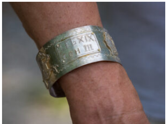
Ehrengabe für den ehemaligen Bürgermeister.

Unter den Helmen und Kettenhemden war jedenfalls am Samstag reichlich der so berühmten Disziplin gefragt, als die Legionäre in Reih und Glied immerhin im Schatten hinter der Holz-Erde-Mauer aufmarschierten. Endlich war das überhaupt wieder möglich. Im Vorjahr hatten die ersten Coronawellen alle römischen Aktivitäten auf Eis gelegt. Deshalb schwitzten alle Beteiligten vom Centurio bis zum Senator mit ausgewiesener Freude. Sogar aus Italien und den Niederlanden waren die Soldaten aufmarschiert. Schließlich ging es um nichts anderes als die offizielle Saisonöffnung im Römerpark.