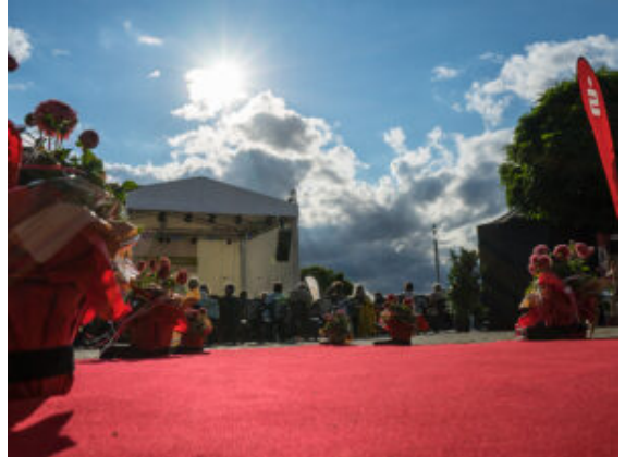
Roter Teppich für Besucher, Star und begeisterndes Orchester.

um seine Begeisterung über den Wiener „Pop-Star“ mit dem ganzen Körper und amüsanten Anekdoten zu unterstreichen. Die Bergkamener riss es jedenfalls nicht nur deshalb dauerapplaudierend von den Stühlen. Was der distinguierte Klassik-Virtuose dort lässig beim „Wiener Abend“ auf den Tasten zauberte, war einfach mitreißend.