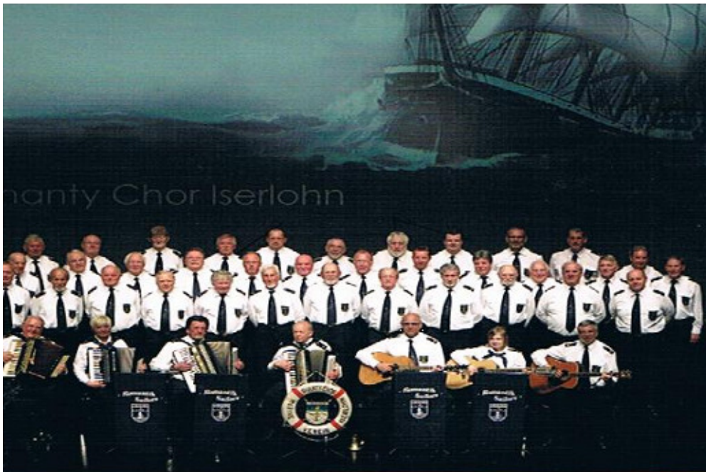
Romantic Sailors Iserlohn

Die Mitglieder dieses Chores sind alt gediente Fahrensleute und wollen das maritime Gedankengut und die seemännische Tradition längst vergessener Windjammer, Klipper, Schiffe und Boote pflegen. Sie erzählen in Ihren Shantys und Balladen von Kapitänen, Matrosen und Janmaaten und möchten so den Alltag auf See dem Publikum näher bringen. Sicherlich war das Leben an Bord bei weitem nicht so romantisch, wie es in den Liedern beschrieben wird. Im Jahre 2002 feierte dieser Chor mit einer Stammbesatzung von 60 Mann sein 100-jähriges Bestehen.