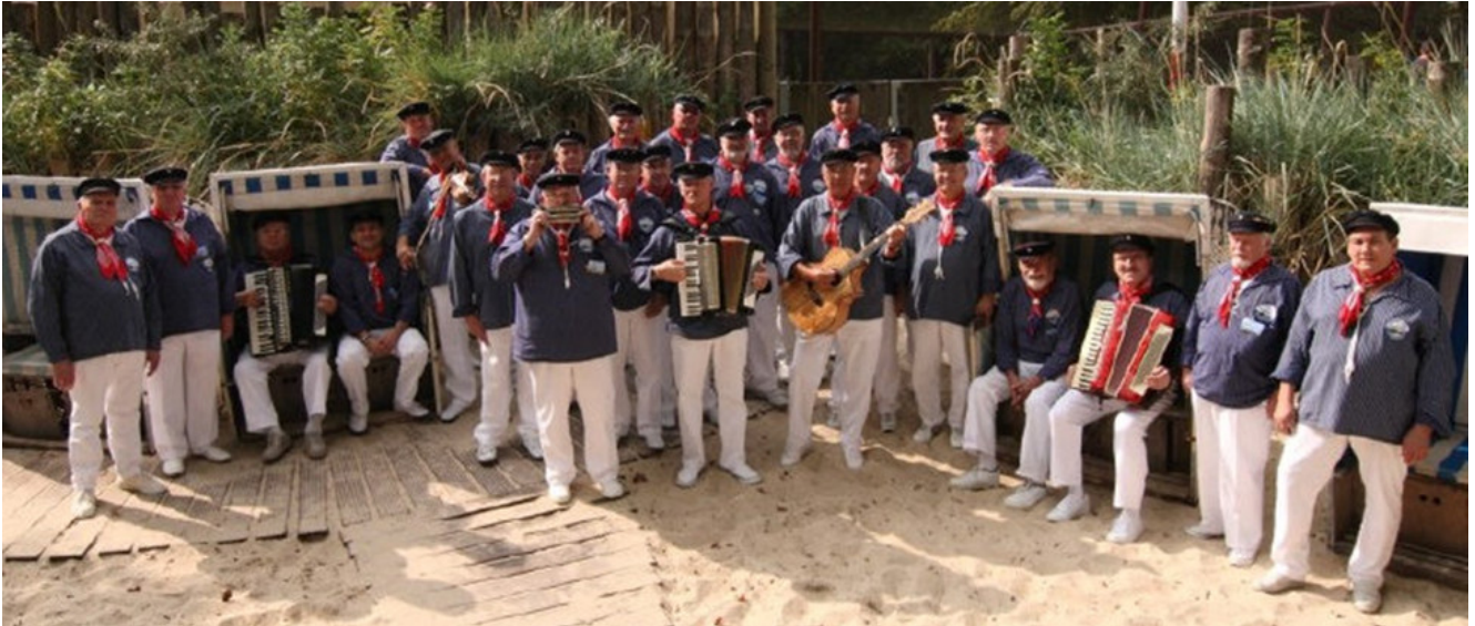
„Die Knurrhähne“ Bochum-Dahlhausen

Bochum–Dahlhausen liegt an der Ruhr. Aber seit Beginn des schienengebundenen Güterverkehrs ist die Ruhr nicht mehr schiffbar. Wer jedoch denkt, in Dahlhausen gäbe es keine Seeleute, der irrt gewaltig. 1903 wurde von damaligen Angehörigen der kaiserlichen Marine, die Linden Dahlhauser Marinekameradschaft, gegründet. Auf Segel und Handelsschiffen fuhren die meisten der heutigen 100 Mitglieder einmal zur See, während sich die Frauen zu Hause um Haushalt und Kinder kümmerten.