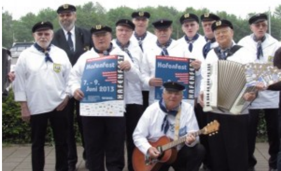
Shanty Chor MK Kamen/Bergkamen