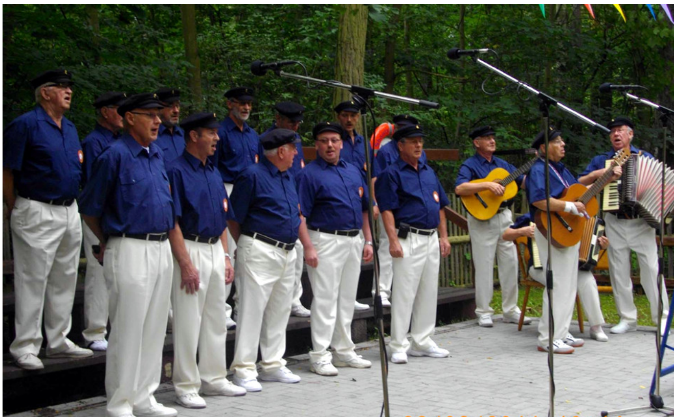
Blaue Jungs vom Wipperstrand Hettstedt

Am 14 Juni 1991 war der Chor der Walzwerker aus Hettstedt zu einem Besuch bei dem gemischten Chor Einigkeit Weddinghofen. Bei dem gemütlichen Beisammensein, am 15. Juni 1991 im Vereinslokal „Zum schrägen Otto“ in Bergkamen Weddinghofen nahm auch der Shanty Chor Blaue Jungs vom Kuhbachstrand teil, der im Jahr 1980 von Sängern des gemischten Chores Einigkeit Weddinghofen gegründet wurde.