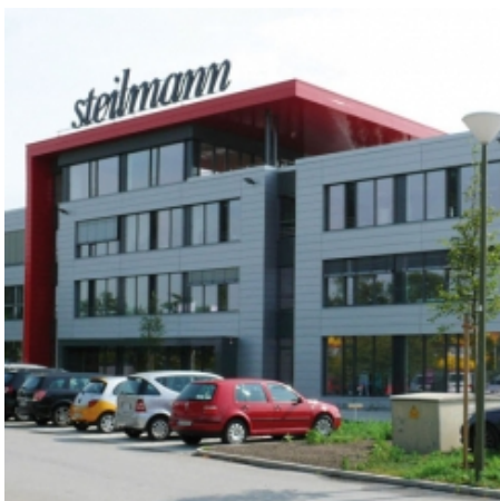
Steilmann-Sitz in Rünthe