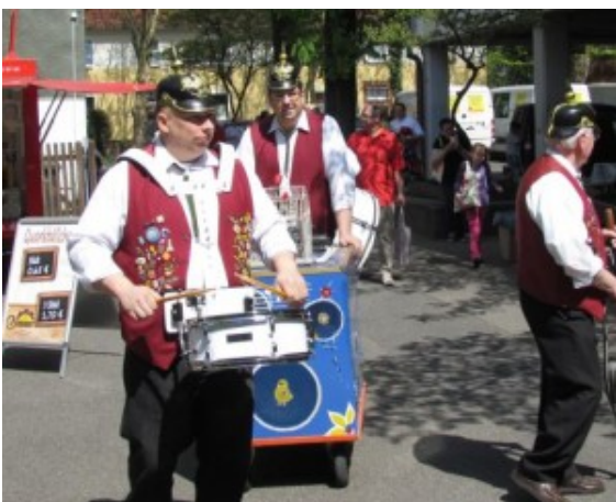
Die „Massener Wandervögel“ auf Blutspende-Werbetour

Dass das Ergebnis so zufriedenstellend war, kann