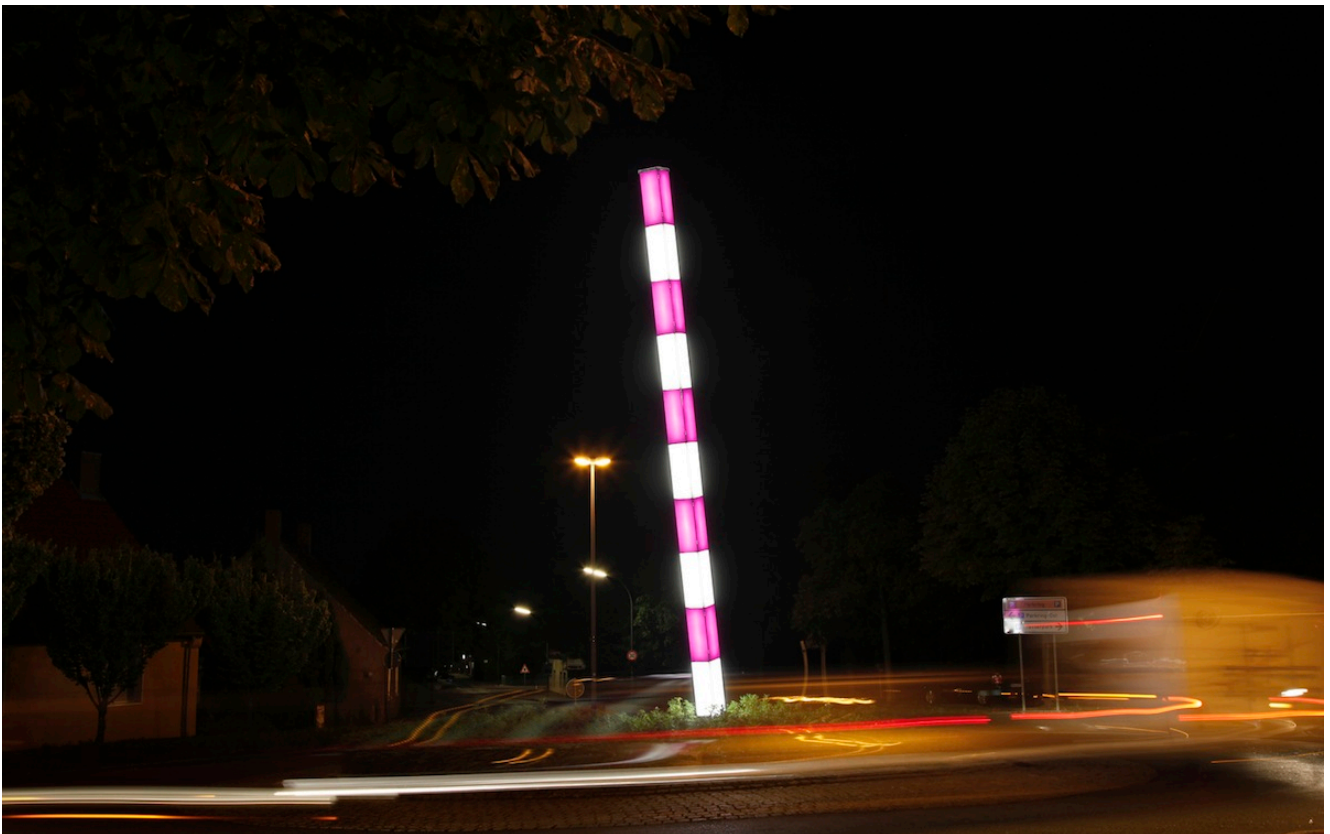
Die Lichtkunststele der Brüder Löbber im Kreisverkehr.

Während des Lichtermarktes (25. Oktober) gibt es ein tolles Angebot für Lichtkunst-Interessierte. Die Stadt Bergkamen bietet sechs geführte Busreisen zu den Bergkamener Kunstwerken an. Kostenlos!