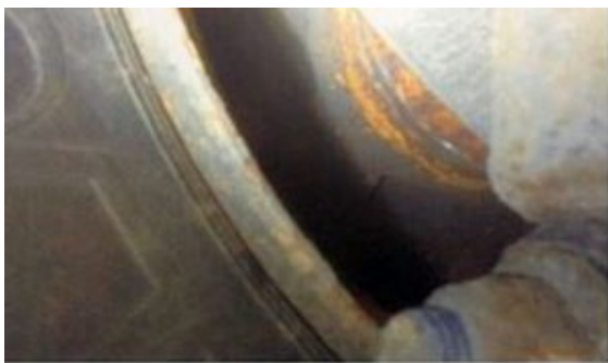
Bremse ohne Bremsscheibe

Dem Verkehrsdienst der Autobahnpolizei ist am Donnerstag auf der A 1 ein Lkw ins Auge gefallen, der zunächst einmal besonders „groß“ erschien. Bei näherem Hinsehen ergab sich eine Mängelliste, die eine Weiterfahrt unmöglich machte.