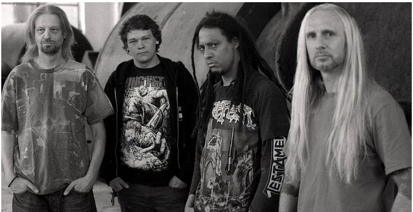
Symmetric Organ.

Ganz im Zeichen des Death Metal steht der Konzertabend am kommenden Freitag, 25. November im JZ Yellowstone.