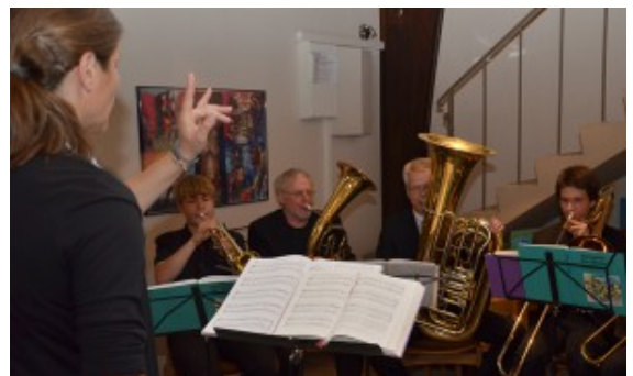
Der Posaunenchor spielte ebenfalls auf.

1951 gründete sich ein Kirchbauverein, 1952 wurde das Grundstück an der Goekenheide erworben. Der erste Spatenstich erfolgte im Juli 1953. Die Weddinghofener packten selbst mit an und bauten die Kirche für 120.000 Mark auf. Orgel, Fenster und Taufstein fehlten – dafür reichte das Geld nicht. Dafür gab es die ehemalige Gutsglocke des Gutes Velmede als Geschenk. Sie läutet heute noch im Gestühl, das nachträglich noch einmal verstärkt werden musste.