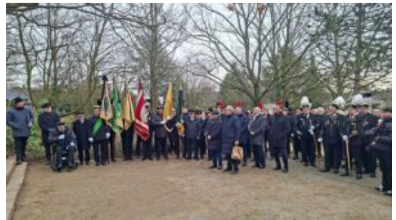
Die Fahnenträger der beteiligten Knappenvereine.