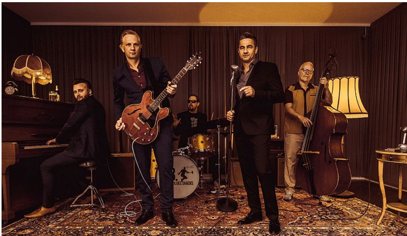
B. B. & The Blues Shacks

Am Mittwoch, den 04.03.2026, um 20.00 Uhr verwandelt sich das Thorheim in einen brodelnden Blues-Tempel, wenn B. B. & The Blues Shacks zu einem unvergesslichen Live-Abend einladen.