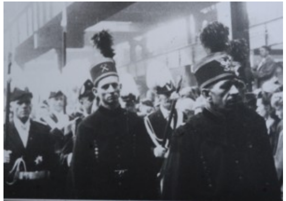
Trauerfeier für die Opfer des Grubenunglück am 20. Februar 1946.

(NGCC). Die Söhne englischer Bergwerksbesitzer interessierten sich damals für einen modernen Kohlehobel, der auf Grimberg 3/4 eingesetzt wurde.