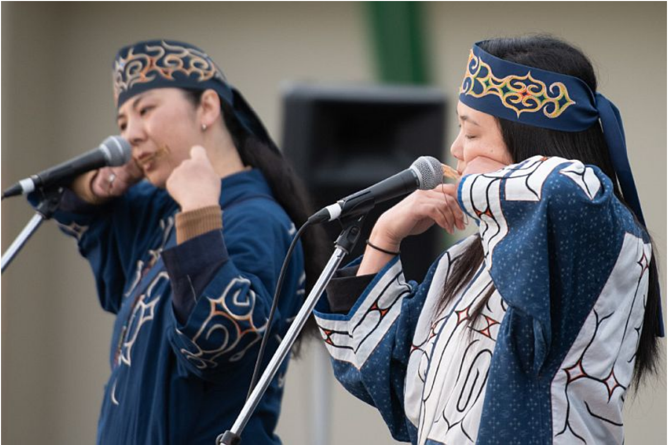
Kapiw & Apappo.

Am Montag, den 16. Februar 2026, um 20 Uhr sind im Trauzimmer der Marina Rünthe erstmals in Europa die traditionellen Lieder der Ainu zu hören.