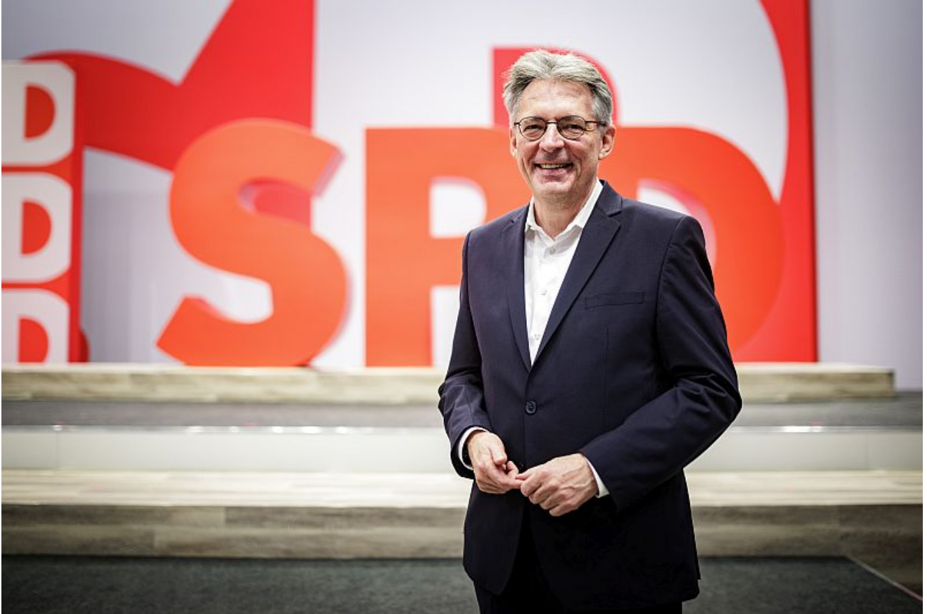
Achim Post.

Die IG BCE Ortsgruppen, Betriebe, VLK und Betriebsgruppen Bergkamen/Kamen veranstalten im Namen des DGB am 1. Mai 2025 unter dem Motto "Mach dich stark mit uns!" ihre traditionelle Maikundgebung. Hauptredner ist Achim Post Landesvorsitzender der NRW SPD und Stellvertretender Vorsitzender der Bundes-SPD