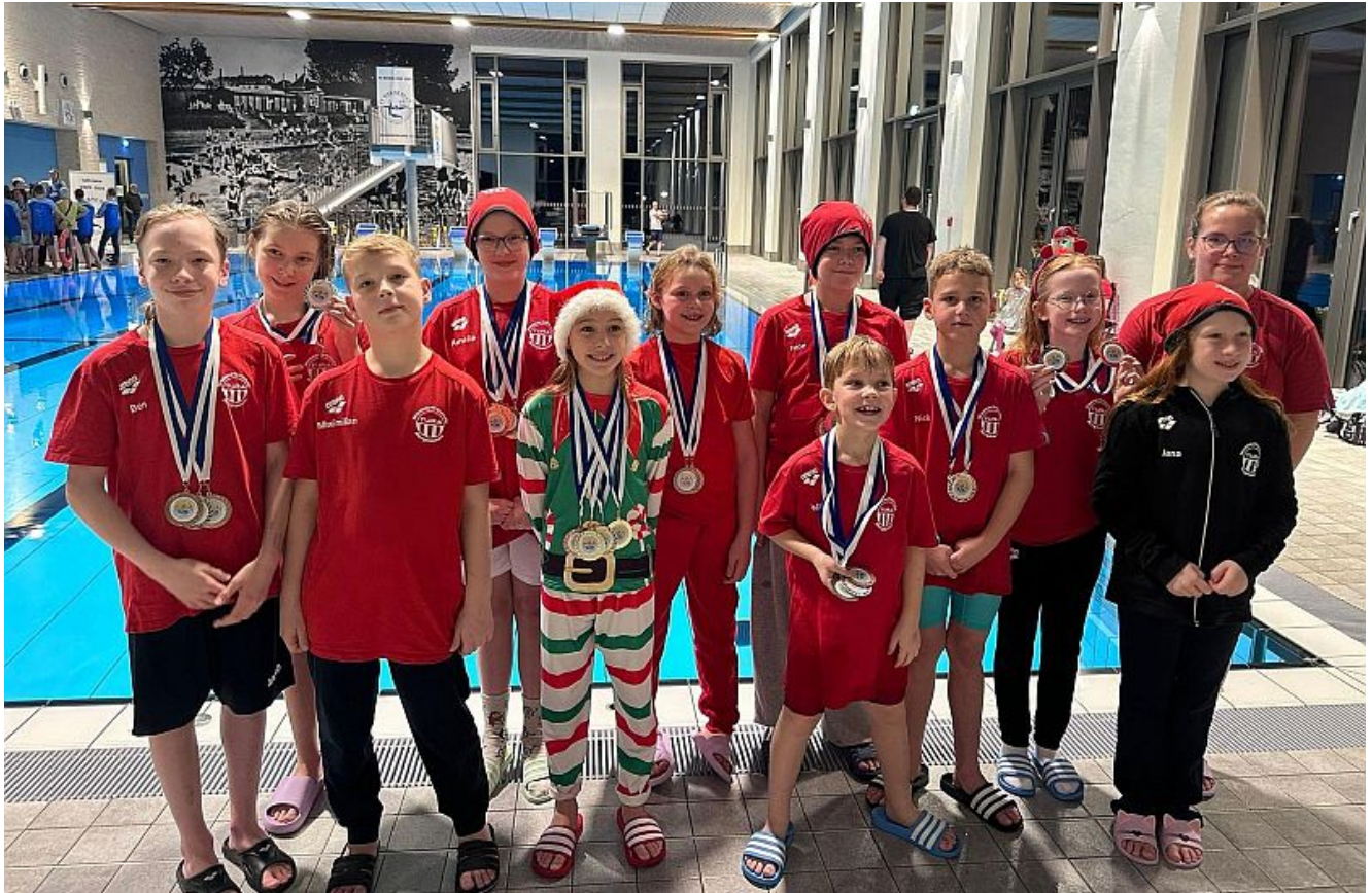
Mannschaftsfoto ältere Jahrgänge

Beim Kinderschwimmfest des TV Werne 03 am 6. Dezember 2025 präsentierten sich die Wasserfreunde TuRa Bergkamen in hervorragender Form. Insgesamt absolvierten die Wasserfreunde 59 Einzelstarts und erreichten dabei starke 30 Podestplätze, davon zwölf erste sowie jeweils neun zweite und dritte Plätze.