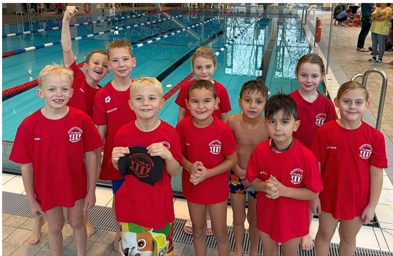
Mannschaftsfoto kindgerechter Wettkampf

Für den Nachwuchs der TuRaner war das Kinderschwimmfest ein rundum gelungener Jahresabschluss, mit dem sich auch das gesamte Trainerteam sehr zufrieden zeigte. Als letzte große Herausforderung in diesem Jahr stehen am kommenden Wochenende für einige Wasserfreunde noch die Südwestfälischen Kurzbahnmeisterschaften an, bevor es in die verdiente Winterpause geht.