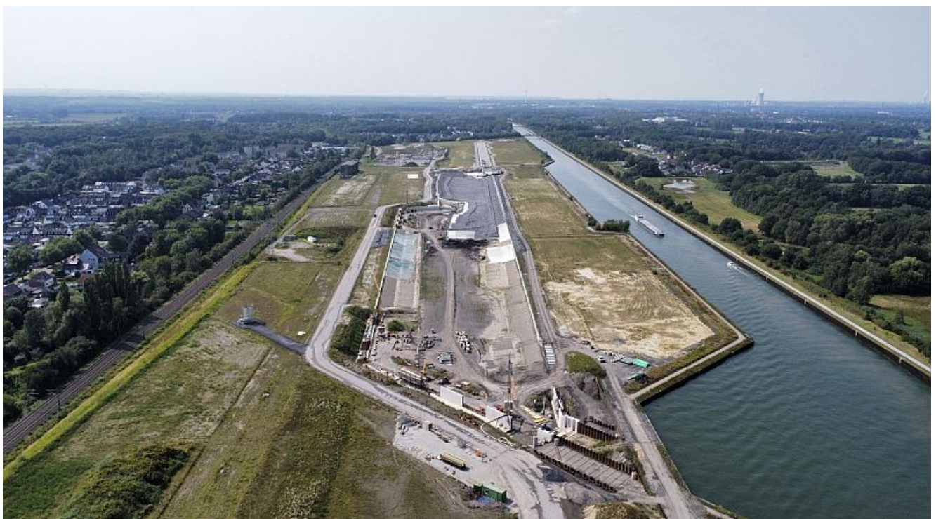
Großbaustelle Wasserstadt Aden.

Gemäß dem Beschluss des Rates der Stadt Bergkamen vom 03.07.2025 wird der Entwurf des Bebauungsplans Nr. 0A 120 „Wasserstadt Aden“ 1. Änderung, inklusive der Begründung, in der Zeit vom 01.09.2025 bis einschließlich 03.10.2025 öffentlich ausgelegt.