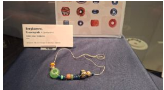
Leihgabe der LWL-Archäologie: Perlen eine Halskette aus dem Grab in Bergkamen.

Kleidung ist so gut wie nix übriggeblieben. Entdeckt wurde die drei Gräber 2011 bei den Erdarbeiten für den damals geplanten Bau des Gewerbeparks A2. Sie gehörten vermutlich zu einem Gräberfeld, das größtenteils während der Arbeiten für den A2 durch Bodenmaterial überdeckt und dadurch auch gesichert wurde.