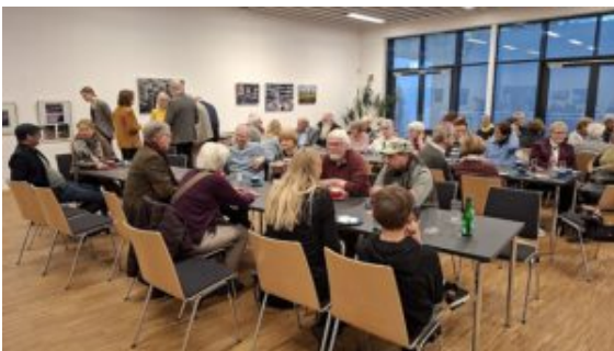
Mitgliedernachmittag des Fördervereins im Stadtmuseum.