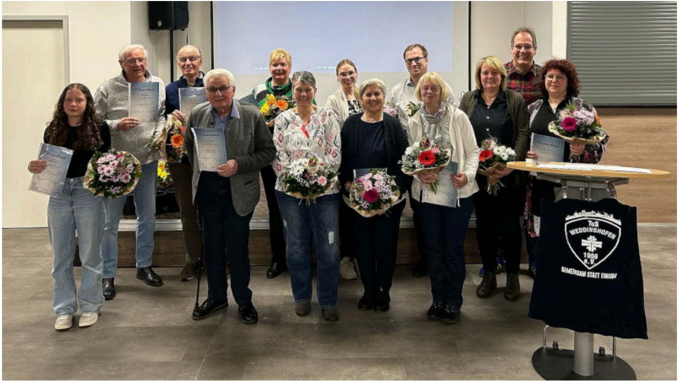
Gruppembild mit den Jubilarinnen und Jubilaren.