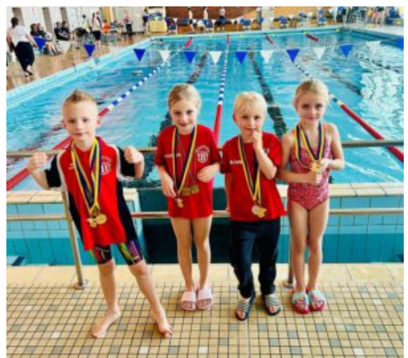
Der Bergkamener Schwimmnachwuchs.

Die 2. Mannschaft und die Nachwuchsschwimmer:innen der Wasserfreunde TuRa Bergkamen waren am 08. und 09. März 2025 zu Gast beim Internationalen Hörder Schwimmfest. Bei insgesamt 48 Einzelstarts sicherten sich die TuRaner 18 Podestplätze und erzielten bei über 60% aller Starts neue persönliche Bestzeiten.