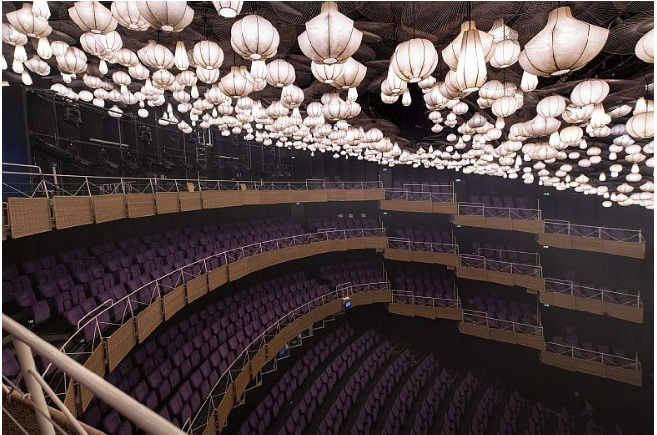
Theater Münster.

Mit dem Angebot „Kultur on Tour – Gemeinsam ins Theater“ lädt das Kulturreferat der Stadt Bergkamen Kulturinteressierte ein, ausgewählte Aufführungen im Theater Münster gemeinsam zu besuchen. Ein eigens eingesetzter Kulturbus bringt die Teilnehmerinnen und Teilnehmer bequem vom Busbahnhof Bergkamen direkt zum Theater und wieder zurück. In gemeinschaftlicher Atmosphäre erleben Theaterfreunde unbeschwert Inszenierungen aus Schauspiel, Musiktheater, Tanz und Oper – ohne Parkplatzsuche oder organisatorischen Aufwand.