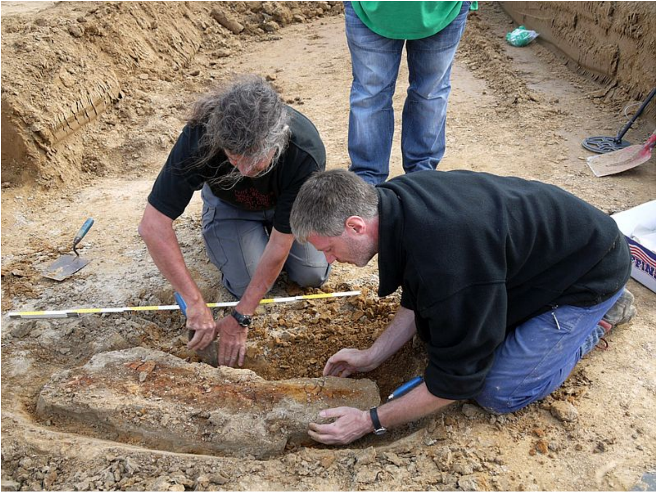
Die Bergung des Fundes in Bergkamen.

Entdeckt wurde sein Grab sowie die Gräber einer Frau und eines Kindes 2011 bei Arbeiten im Logistikpark A2. Dabei zeigte sich, dass der „Krieger von Bergkamen“ mit Beigaben auf seine letzte Reise geschickt wurde, die die Fachwelt aufhorchen ließ. Dazu schreibt der LWL: „Nicht nur weist es eine umfangreiche, vergleichsweise reiche Ausstattung auf, es ist auch das bislang einzige gesicherte Grab mit einer Spatha (Schwert) in der Mitte des 7. Jahrhunderts in Westfalen.“