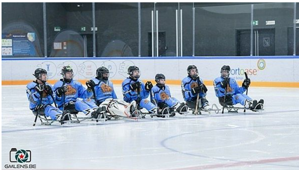
Mannschaft der Grizzlys Bergkamen

Die Para-Eishockeymannschaft der Grizzlys Bergkamen schlagen die Phantoms in Antwerpen verdient mit 3:0.