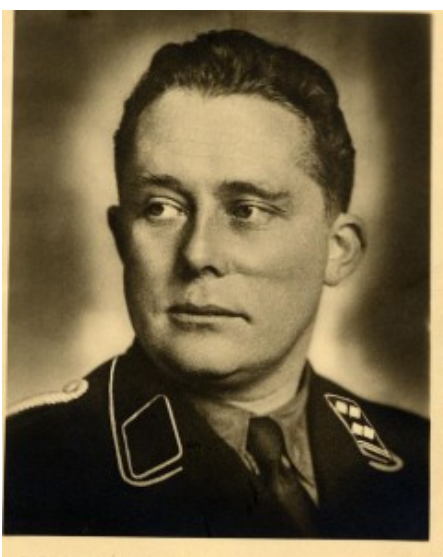
Kommissarischer Landrat des Kreises Unna Wilhelm