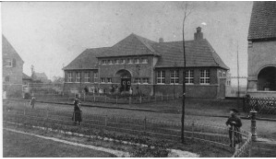
Ehemaliges Wohlfahrtsgebäude in der Bergarbeitersiedlung Schönhausen