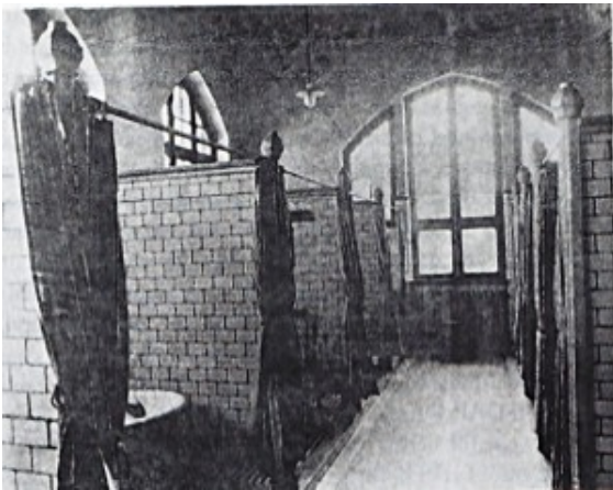
Waschkabinen im Wohlfahrtsgebäude