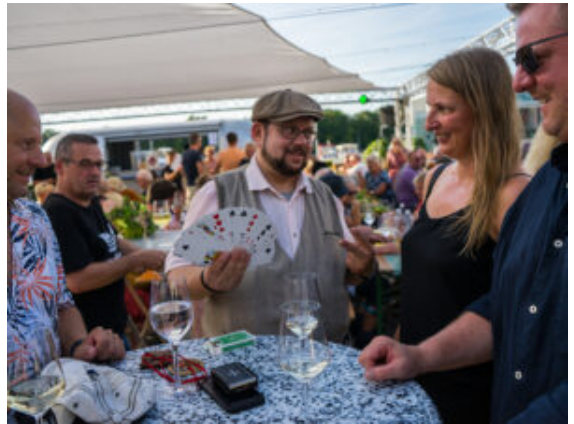
Zauberei mitten in der Besuchermenge.

Reiseneccessaires – allesamt aus ausgedienten Fahrradreifen. „Ich fahre viel Rad, dabei kam mir die Idee“, sagt die Künstlerin.