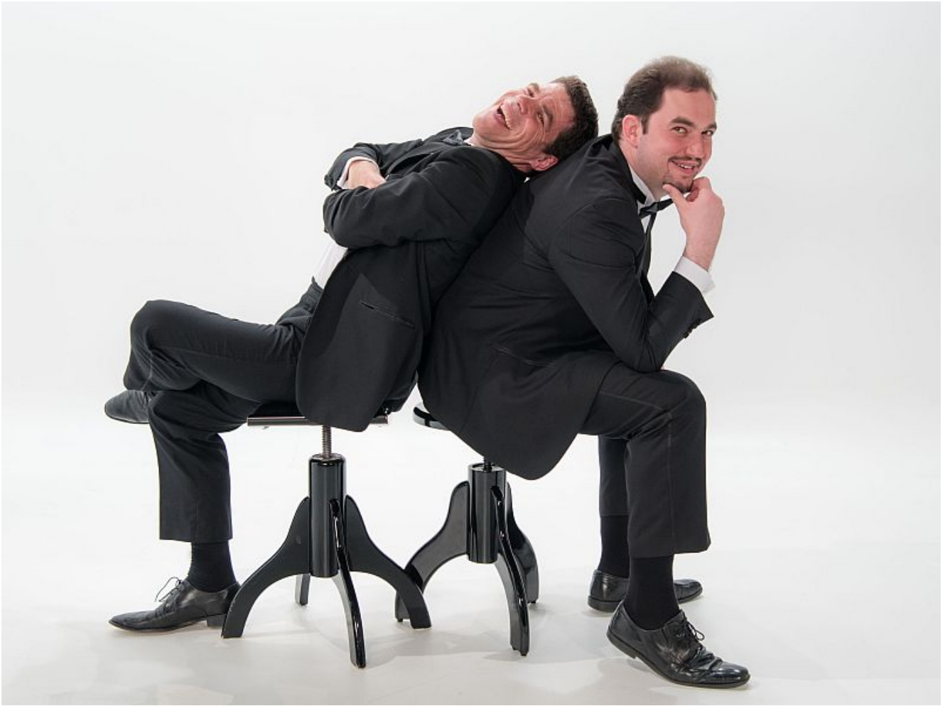
Das Duo Notenlos.

Die Künstler Pusch & Speckmann geben die „Living Jukebox“ und präsentieren ein Wunschkonzert der Extraklasse, das man so noch nie gehört hat – und das auch jedes Mal anders klingt. Ganz nach Lust, Laune und Kreativität der Gäste. Beim nächsten Kulturpicknick am 26.07.2024 kann das Publikum im Römerpark um 19.00 Uhr live dabei sein, und den Abend aktiv mitgestalten.