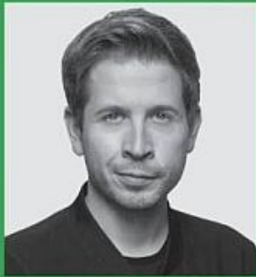
Hauptredner: Kevin Kühnert SPD-Generalsekretär MdB