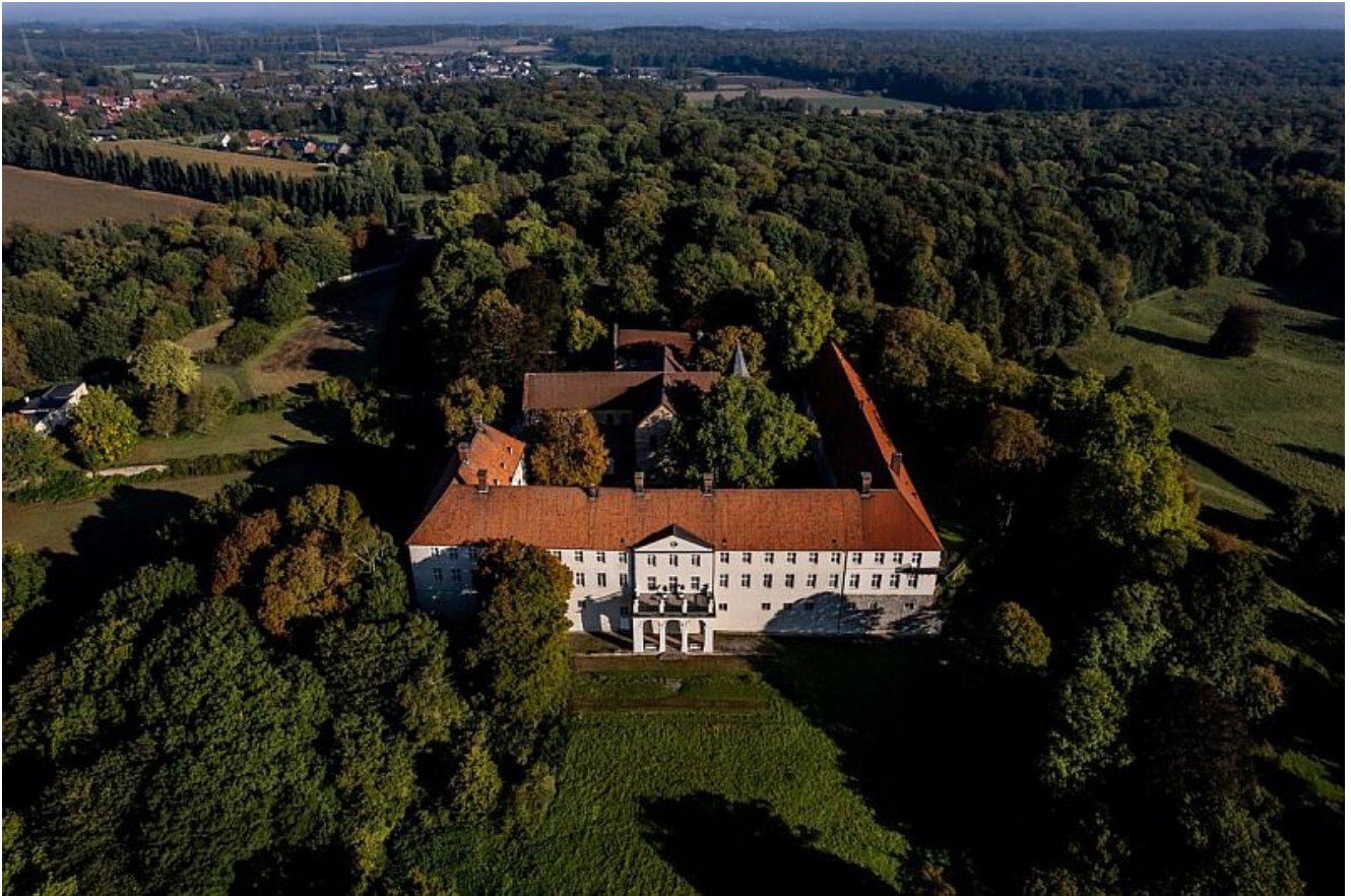
Schloss Cappenberg mit Stiftskirche.

Der Kreis Unna organisiert wieder Kreisrundfahrten: Gästeführer von HanseTourist informieren bei Bustouren über die Städte und Gemeinden, die Landschaften und die Menschen im Kreis Unna. Gebucht werden können Touren durch den Norden und Süden des Kreises. Die Kosten für den Bus übernimmt sogar der Kreis Unna – nur Verpflegung und Kaffeetrinken in ausgewählten Lokalen müssen die Gäste selbst zahlen.