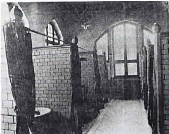
Waschkabinen im Wohlfahrtsgebäude