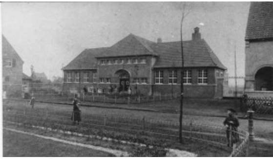
Ehemaliges Wohlfahrtsgebäude in der Bergarbeitersiedlung Schönhausen