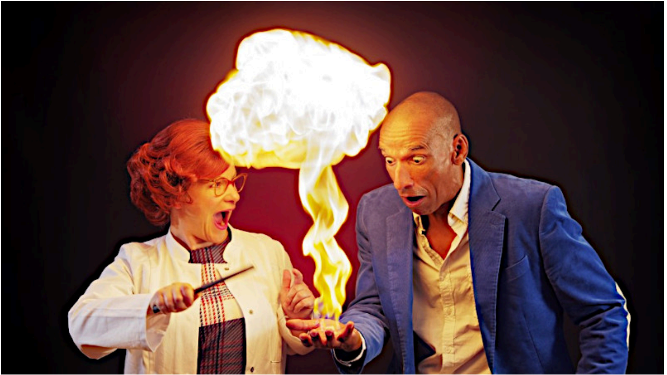
Die Physikanten.

Der Sommer ist die richtige Zeit, um eine Open-Air-Veranstaltung zu besuchen: Die Sonne im Gesicht, ein kühles Getränk in der Hand und Künstler*innen auf der Bühne erleben – was gibt es besseres.