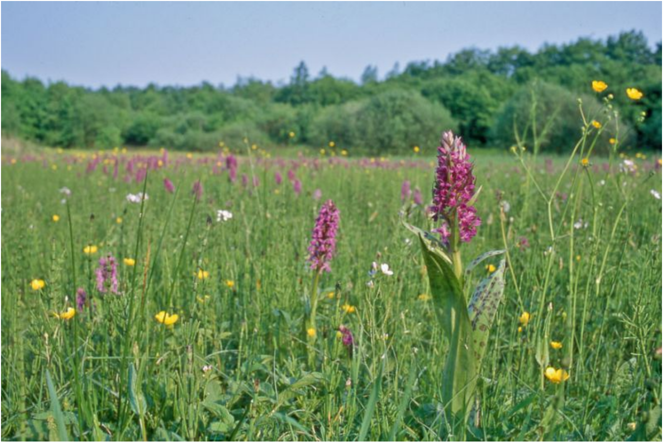
Breitblättriges Knabenkraut

Seit 1982 wird die Nasswiese in Bergkamen-Heil durch den ehrenamtlichen Naturschutz gepflegt. Der NABU-Kreisverband Unna organisiert die Mahd und das Abtragen des Mahdgutes. Im Jahr 2019 haben wieder zahlreiche Helferinnen und Helfer der Südkamener Kindertageseinrichtung „Unter dem Regenbogen“ bei dieser Arbeit geholfen.