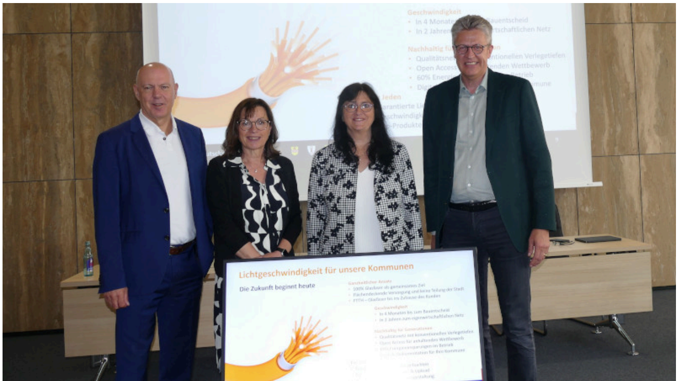
Pressekonferenz zum Glasfaserausbau im Kamener Rathaus.

Die Deutsche GiGa Netz GmbH will bis 2026 Bergkamen, Kamen und Bönen flächendeckend mit Glasfaseranschlüssen versorgen. Das wird von den drei Räten begrüßt. Sie haben am Donnerstag in gleichzeitig laufenden Ratssitzungen eine Kooperationsvereinbarung mit dem Unternehmen beschlossen.