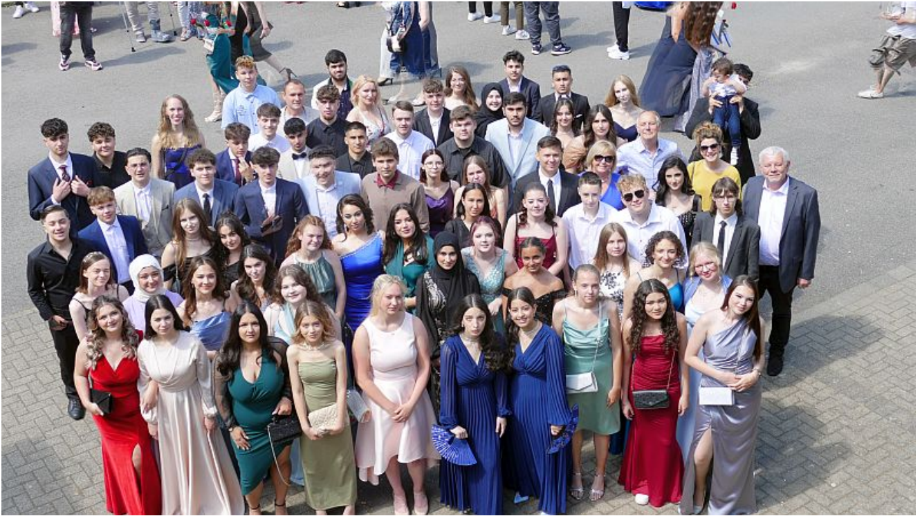
Die Abschlusschüler der Klassen 10d, e und f.