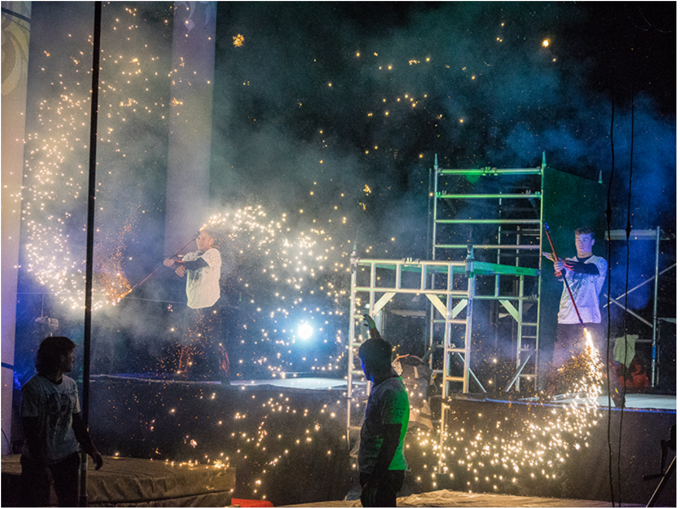
Funkensprühende Action auf dem Stadtmarkt.

Eine Waldelfe auf Stelzen ganz für sich allein. Oder eine lauschige Zwiesprache mit einem sprechenden Vogel-Hochhaus. Klitschnass ist nicht nur der Apfel, den die beleuchteten Schaufensterpuppen hinter dem Baumstamm hervorstrecken. Mancher wadet bis zu den Knöcheln in Pfützen und Schlamm beim Lichtermarkt. Wer am Freitag Geduld hatte, der wurde belohnt. Nach gut zwei Stunden hörten die ganz schlimmen Sturzbäche auf. Freie Bahn für Feuer, Licht und richtig gute Herbstlaune.