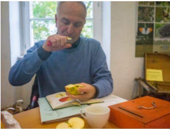
Pomologe beim Apfeltest.

Unter den neuesten Stammgästen ist auch ein exotischer Vogel. Ein Kakadu beäugte schon im vergangenen Jahr hochinteressiert auf der Schulter seiner Besitzerin, was hier alles vor sich ging. Am Samstag war er wieder da, nicht weniger neugierig. Besonders begeistert war er von der Steeldrum-Gruppe, die trommelnd an den Ständen der fast 80 Aussteller vorbeizog. Die vielen Äpfel dürften es ihm nicht weniger angetan haben.