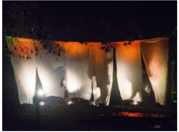
Spiel mit Licht und Schatten.

Ganz Hartgesottene gönnten sich ein Spiel mit dem Lichtprojektor, ein Selfie mit Leuchtmitteln am Körper oder einen kleinen Schattentanz hinter dem tropfenden beleuchteten Stoffvorhängen. Die fabelhaften Fantasy-Stelzenwesen hatten es auch nicht leicht. Ihre federleichten Kostüme waren schon nach dem ersten Nieselregen klitschnass. Mit strahlendem Lächeln stolzierten sie dennoch durch die Menge und verbreiteten neben Faszination auch echte Verzückung. Nur die ganz Nüchternen wollten es nicht so recht glauben: „Was soll das denn sein?“, fragte ein junger Besucher im Kindergartenalter kritisch die Waldelfe, die darauf eine verblüffend direkte Antwort in einer verqueren Fantasiensprache hatte.