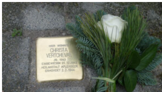
Stolperstein für Christa Vertcheval an der Schlägelstraße in Rünthe.

Gründen verfolgt wurden, sowie an Elisabeth Rumpf, die zwangssterilisiert wurde.