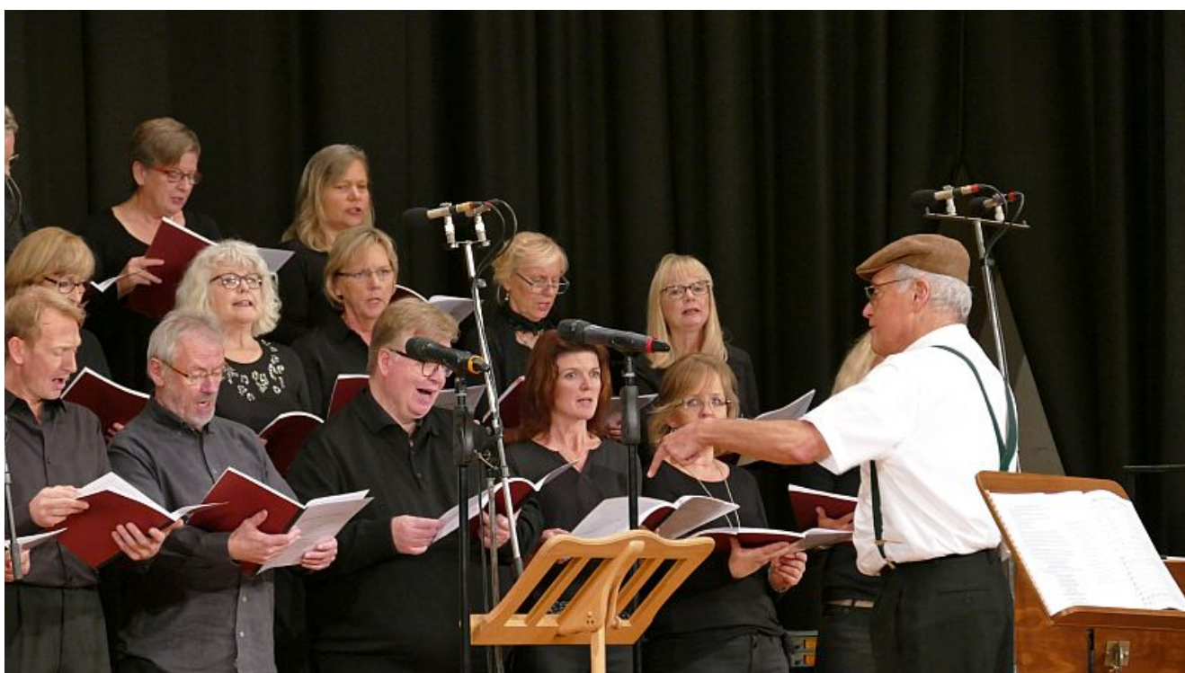
Der Chor „Die letzten Heuler“

„Wie wir leben wollen“ ist der Titel des Programms, das der Kamener Chor „Die letzten Heuler“ am Sonntag, 12. März, um 18 Uhr in der Christuskirche an der Rünther Straße in Bergkamen-