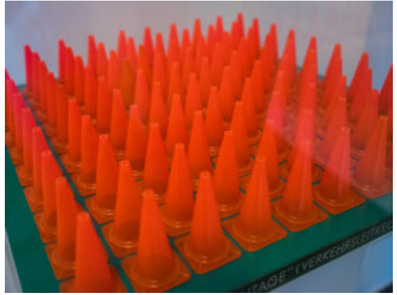
Verkehrsleitkegel als Kunst im Modell.

Seine Verkehrsleitkegel kamen in Bergkamen wieder zurück in den echten Straßenverkehr und wurden von der Realität verbraucht. Im Museum sind sie als Modell zu bewundern. Seinen Körperabguss, angefertigt von Prof. Kampmann als kopfstehendes Denkmal seiner selbst, eingelassen in die Erde, in der sich das eigentliche Bergkamener Leben damals noch abspielte, wurde Opfer eines Lkw-Angriffs. Ulrichs ließ das Werk in Bronze reproduzieren. Heute wartet es auf dem Künstlerfriedhof in Kassel darauf, mit seiner Asche und der seiner Frau gefüllt zu werden. Wer zuerst hier eingekehrt und ob am Ende „alles verrührt wird“, spielt fast keine Rolle. Die romantische Geste zählt.