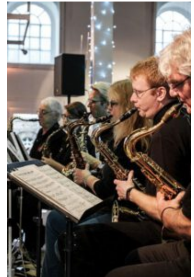
Triple B.

Für den beliebten „Swing in den Heiligabend“ am 23.12. in der Ökologiestation mit der Bigband TRIPLE B der Musikschule ist noch ein kleines Kontingent an Eintrittskarten erhältlich. Der Vorverkauf endet jedoch bereits am Dienstag, 19.12.! Bis dahin gibt es die Eintrittskarten zu je 8,50€ direkt im Kulturreferat, Rathausplatz 4 (direkt neben der Sparkasse), 02307/965-464.