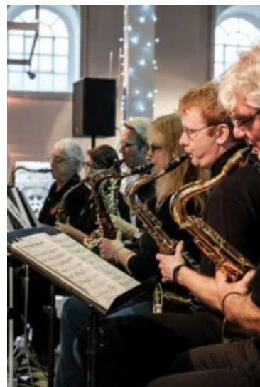
Triple B.

Für den beliebten „Swing in den Heiligabend“ am 23.12. in der Ökologiestation mit der Bigband TRIPLE B der Musikschule ist noch ein kleines Kontingent an Eintrittskarten erhältlich. Der Vorverkauf endet jedoch bereits am Dienstag, 19.12.! Bis dahin gibt es die Eintrittskarten zu je 8,50€ direkt im Kulturreferat, Rathausplatz 4 (direkt neben der Sparkasse), 02307/965-464.