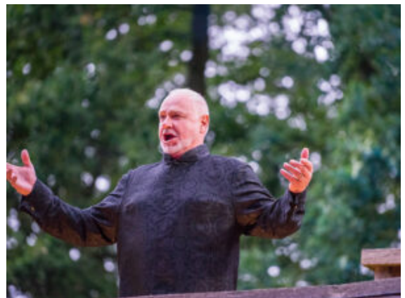
Der „Deutsche Tenor“ in voller Aktion.

Nach der Zirkusprinzessin, musikalischen Ausflügen nach „Wien, nur du allein“ und zu den blühenden Bäumen im Prater, Donner und Blitz in der Polka, Liebesgrüßerinnerung mit „Vergissmeinnicht“ und tausend kleinen singenden Engeln boten sich in der Pause noch einen besonderen Höhepunkt. Der einzige verbliebene Germane des historischen Römerpark-Teams vertrat seine durch einen Unfall verhinderten Kollegen mit großzügiger Gastfreundschaft und ließ die Besucher in seine noch nicht ganz fertige Handwerkerbehausung schauen. Die Bemalung am nur teilweise verputzten Fachwerk fehlt zwar noch. Bett, Schrank, Hausaltar und Tisch sorgen aber schon für heimelige Stimmung direkt neben der Werkstatt für die Schmiede und Dachdecker. Und hier waren die Besucher auch vor den gefräßigen Mücken sicher, vertrieben von echtem Weihrauch aus dem Oman.