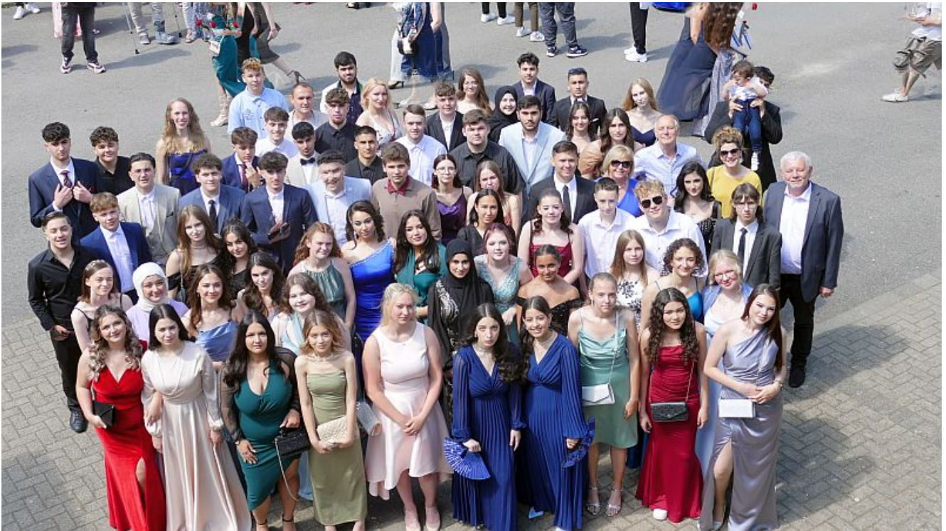
Die Abschlusschüler der Klassen 10d, e und f.