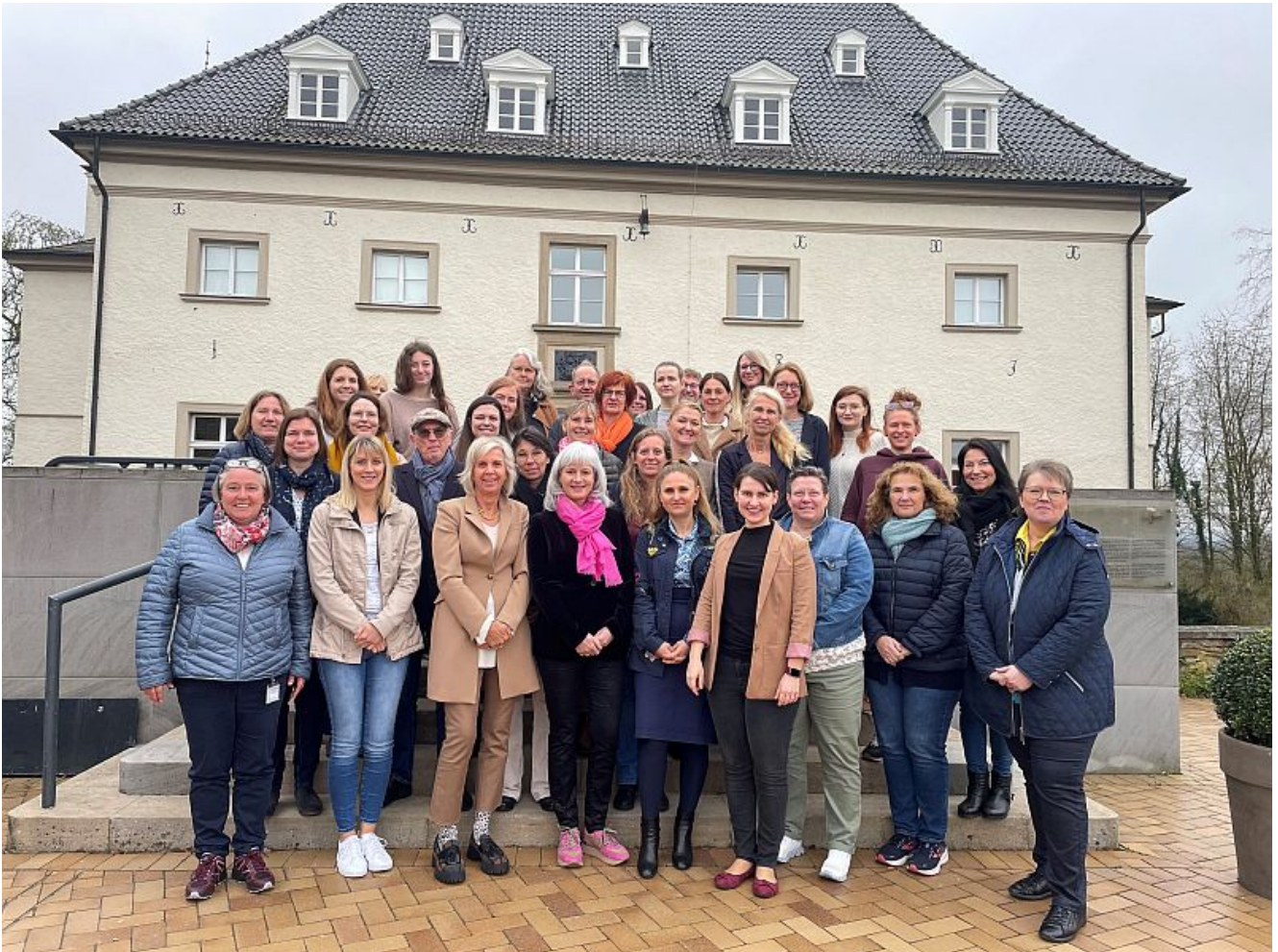
Die Teilnehmenden vor dem Veranstaltungsort.

Austausch untereinander, Vernetzung und die Arbeit der Kooperationspartner besser verstehen – das war das Ziel eines Fachtages des Runden Tisches gegen Häusliche Gewalt im Kreis Unna. Diesmal stand im Mittelpunkt der Veranstaltung das Thema „Opferarbeit“. Das Treffen fand am 18. April auf Haus Opherdicke statt.