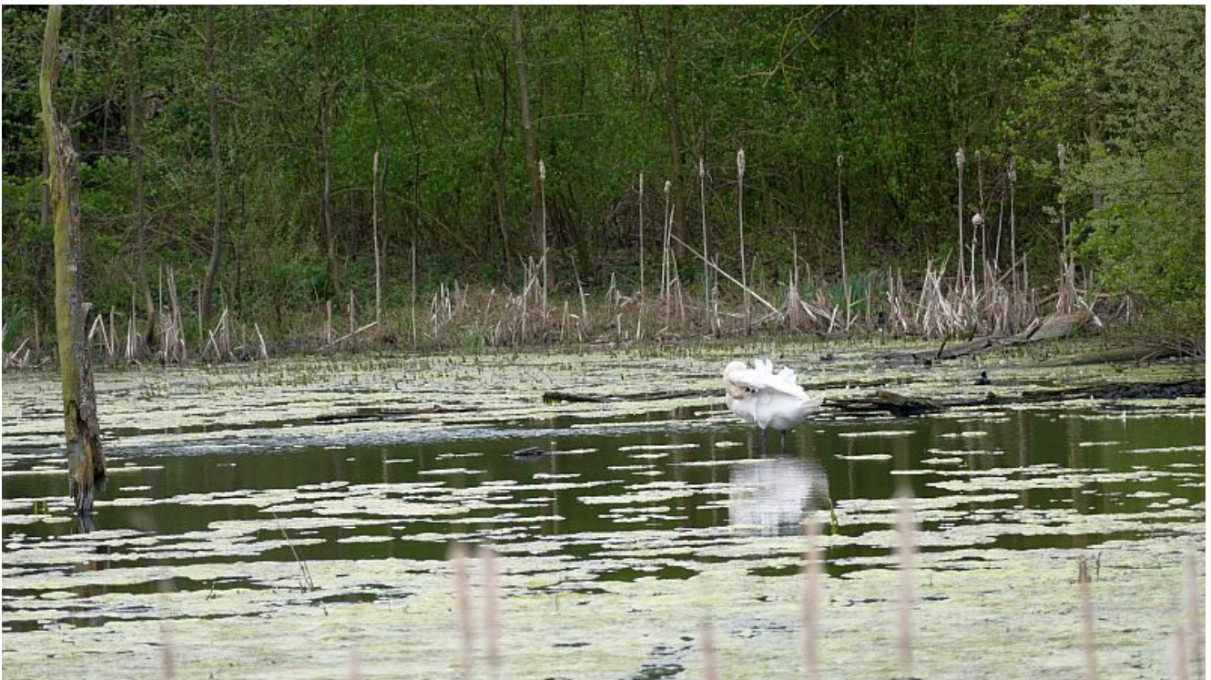
Schwanenweiher an der Erich-Ollenhauer-Straße.