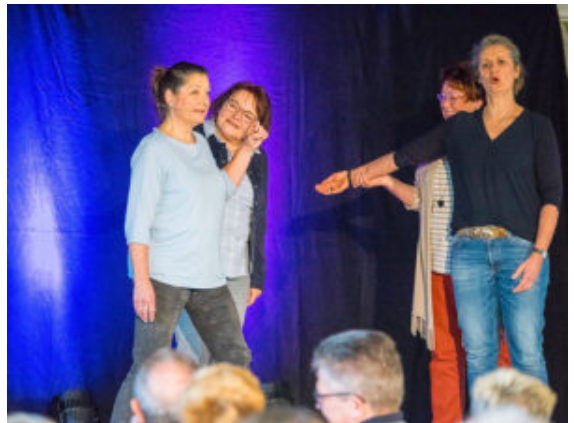
Lebendiges Puppentheater auf der Bühne.