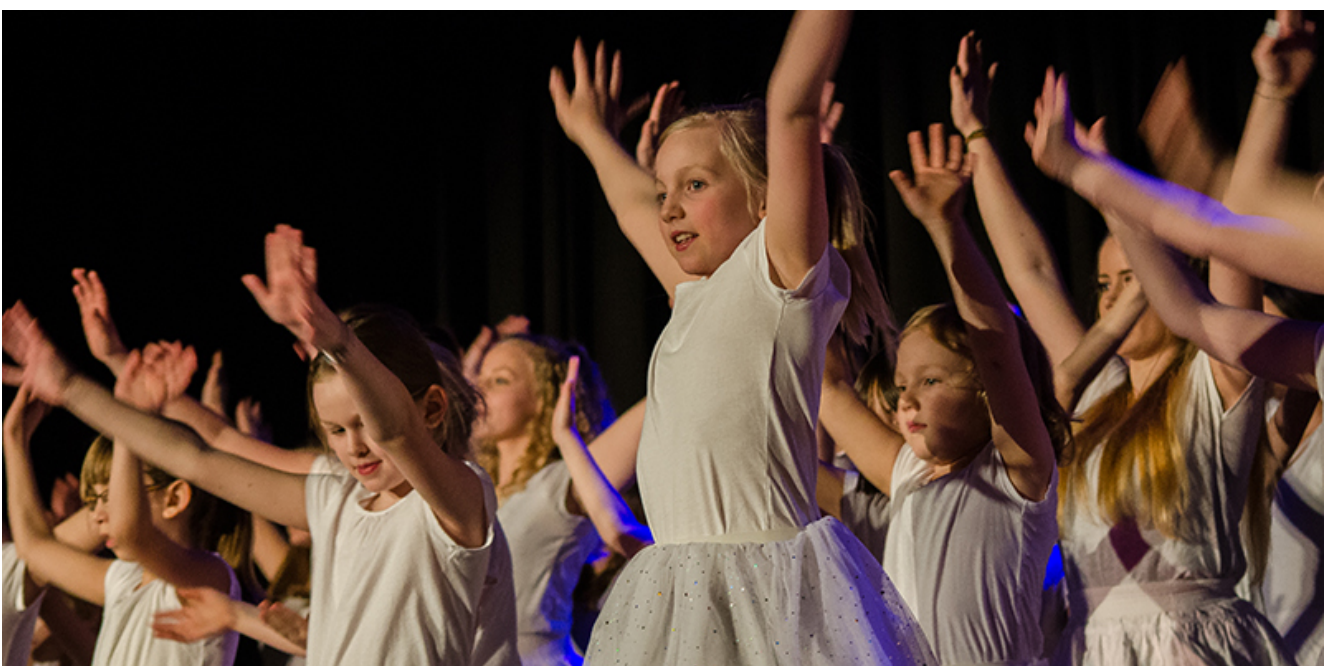
Theaterfestival in der Vor-Corona-Zeit.