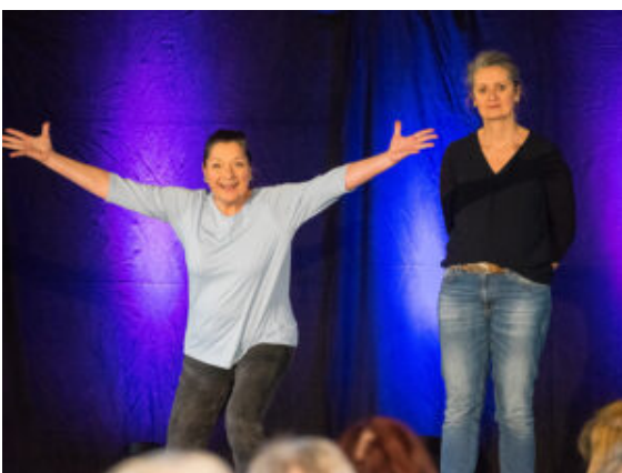
Juchu: Frau sein macht Spaß