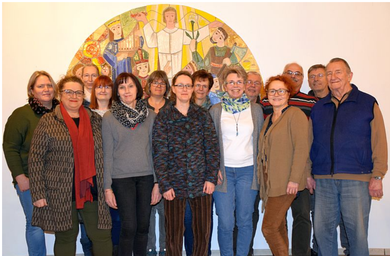
Kirchenchor Kreuz & Quer.