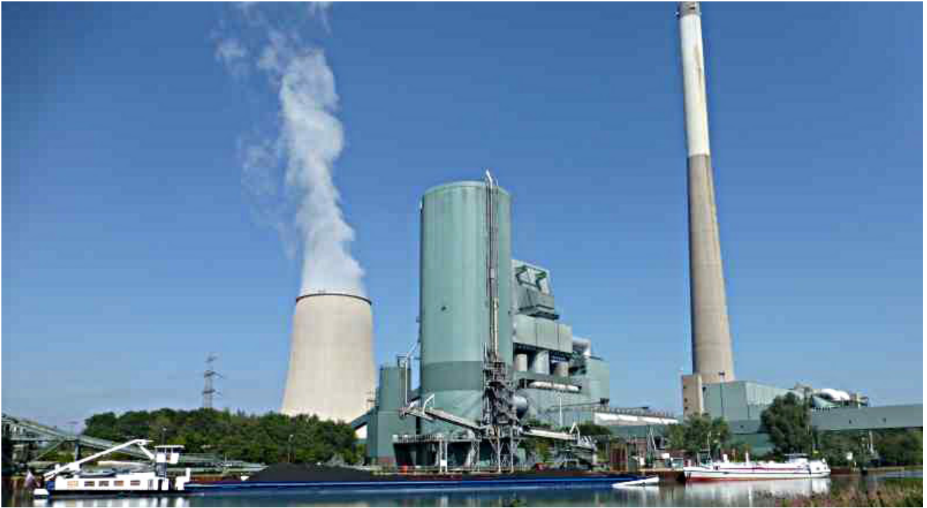
Das Steinkohlekraftwerk in Heil.