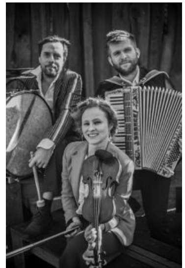
Trio Wowakin.